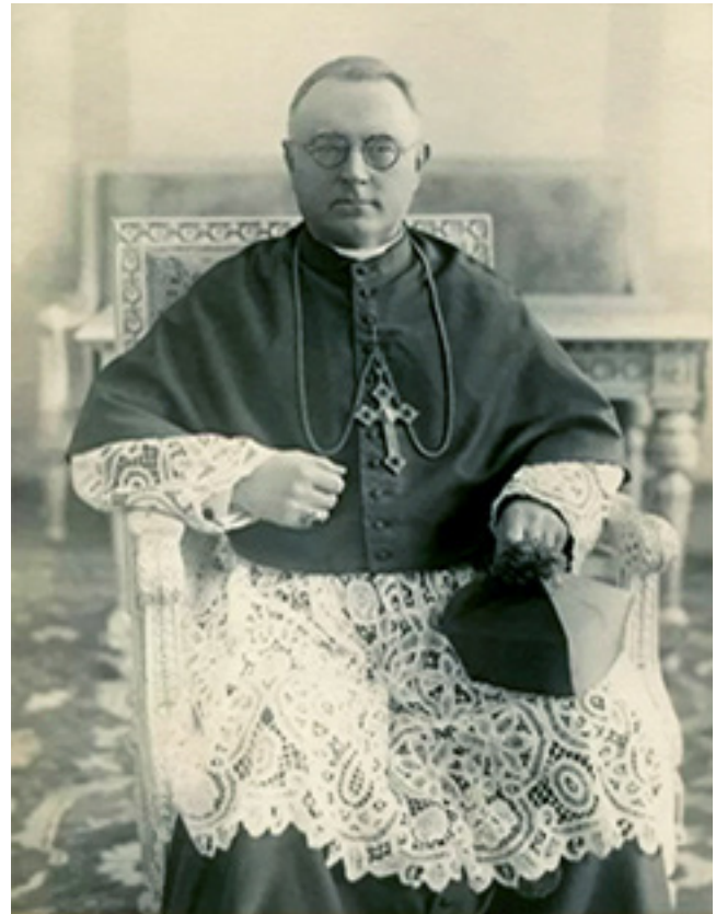
Vyskupas Justinas Staugaitis.

1909–1912 m. J. Staugaitis buvo katalikiško, inteligentijai skirto mėnraščio „Vadovas“ redaktorius, garsėjo kaip produktyvus publicistas, katalikų ideologas. Savo darbus tikybos, moralės, politikos ir kitomis temomis skelbė įvairiuose ano meto periodiniuose leidiniuose, daugiausiai „Šviesoje“, „Ūkininke“, „Šaltinyje“, „Viltyje“, „Vilniaus žinio-