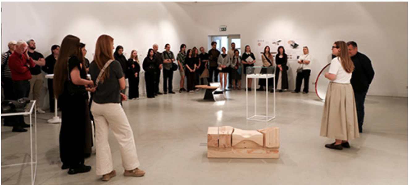
VDA Telšių fakulteto studentų baigiamųjų darbų parodos atidarymo akimirka