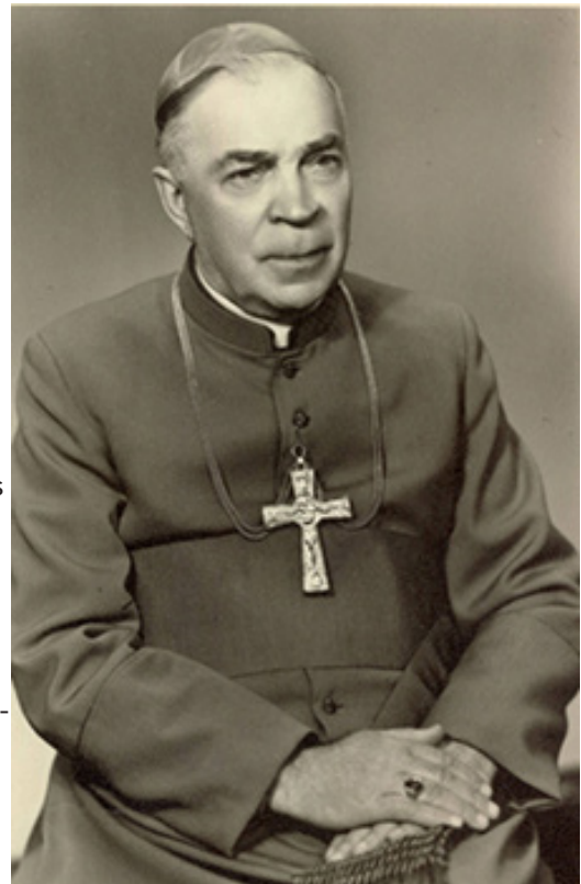
Vyskupas Juozapas Pletkus.

2. „Liudvikas Povilonis“, Kauno arkivyskupija : https://kaunoarkivyskupija.lt/arkiv-povilonis/ .