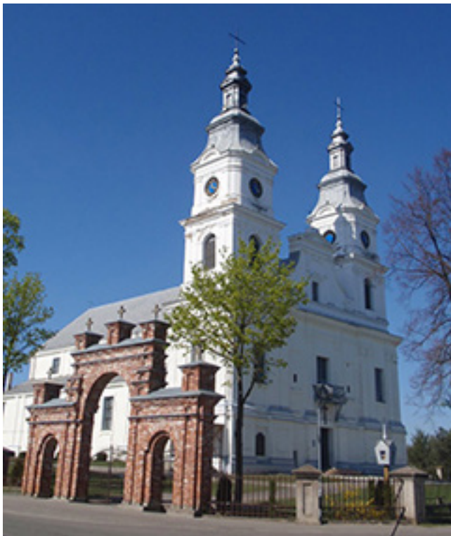
Žemaičių Kalvarijos Švč. Mergelės Marijos Apsilankymo mažoji bazilika.

kaimą. Valančiai buvo pasitutintys ūkininkai, turėjo galimybę leisti vaikus į mokslus. Iki penkiolikos metų būsimasis vyskupas gyveno pas tėvus, padėjo jiems ūkio darbuose, laisvalaikiu savarankiškai mokėsi.