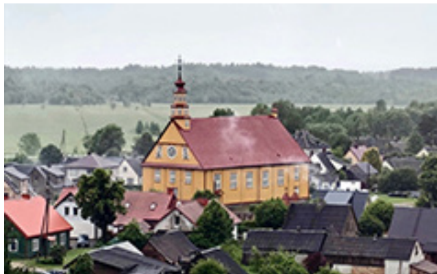
Varnių Šv. Aleksandro bažnyčia