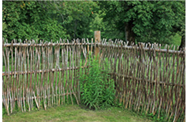
Vėngalė Bonipaca portėgrapėjė

Agnė, matīdma, ka Sėmuons ruošas atnaujintė malūna, nedrīsa anuo stabdītė, muokītė ė ramintė,