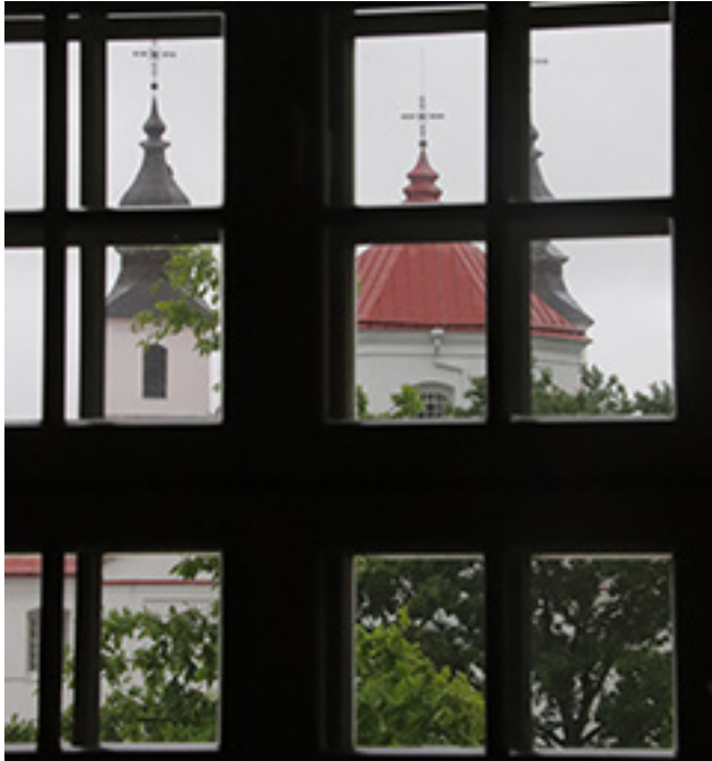
Varnių Šv. apaštalo Petro ir Pauliaus bažnyčios (buvusios katedros) pastatas (vaizdas žiūrint pro ŽMA Žemaičių vyskupystės muziejaus langus)

dabro-aukso lydinio apkaustais. Be šių dviejų svarbiausių altorių, čia dar yra ir Lietuvos globėjo Šv. Kazimiero, Šv. Kryžiaus, Šv. Juozapo, Šv. Šeimynos, Šv. Jurgio (Varnių ir visos Lietuvos globėjo), Šv. Stepono (Vengrijos patrono) ir kitų šventųjų altoriai.