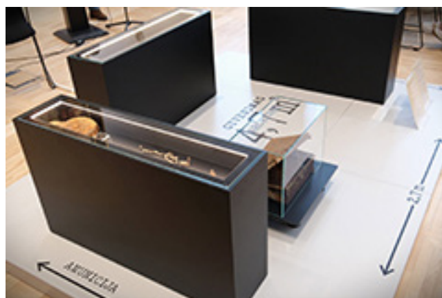
Parodos „Gyvenimas 4,7 m 2 “ fragmentai