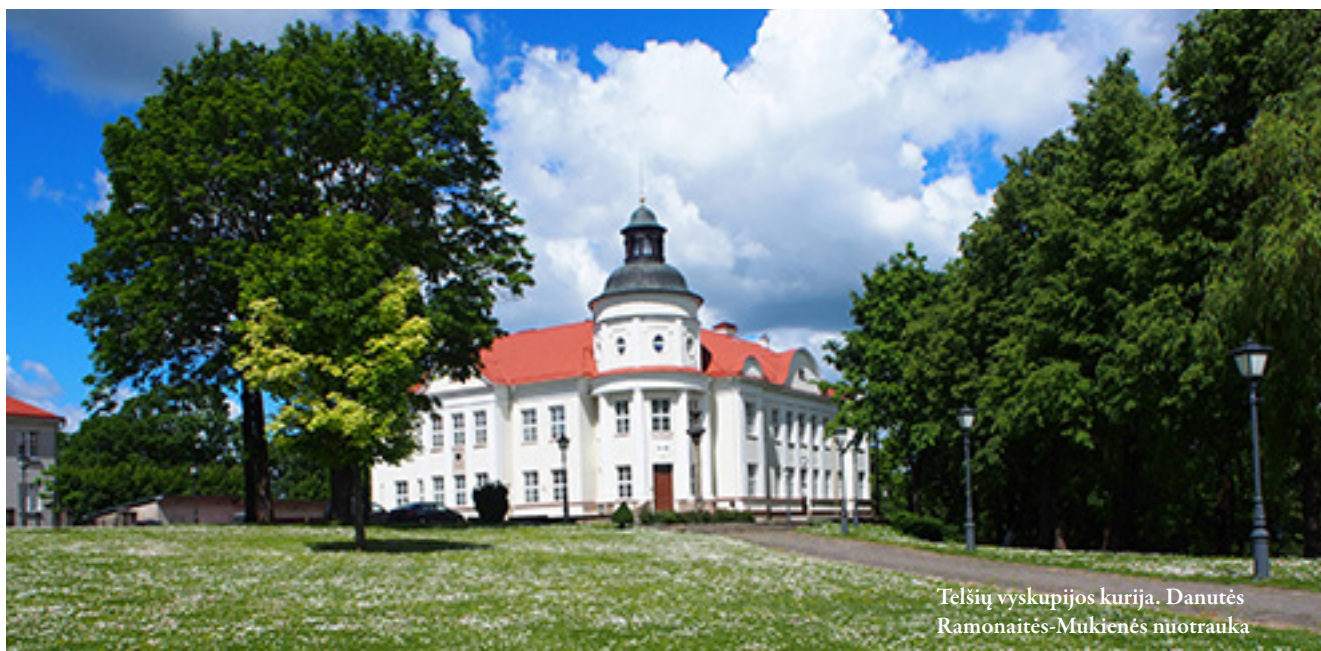
Telšių vyskupijos kurija.