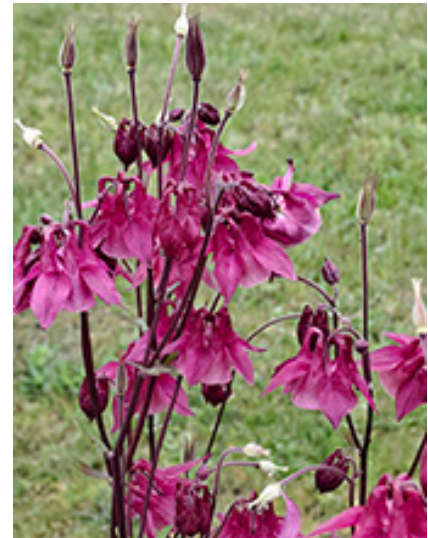
Vasaras žīdā. Vėngali Bonipaca porti-grapiji

Susigūnžėn patupiejuom, Kuol šīk tīk atsikūtiejuom. Tik i numus parsikapstėn, Šalta vieji atsikratėn, Liekdavuom jau ont kalnioka. Kuoc viejukā sninga soka, Kuol tievā numī navara, Mas su viejės daviem gara.