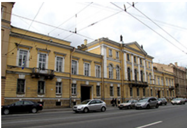
Buvęs iš Vilniaus į Sankt Peterburgą perkeltos Vilniaus dvasinės akademijos pastatas 2011 m.

ryti mokslą. Meilė vaikų ir apskritai jaunosios kartos buvo charakteringas kapeliono širdies privalumas.“