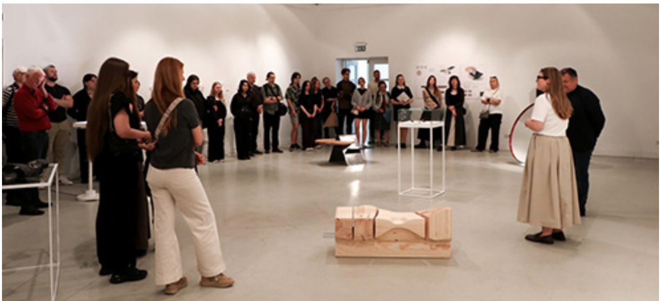
VDA Telšių fakulteto tudentų baigiamųjų darbų parodos atidarymo akimirka