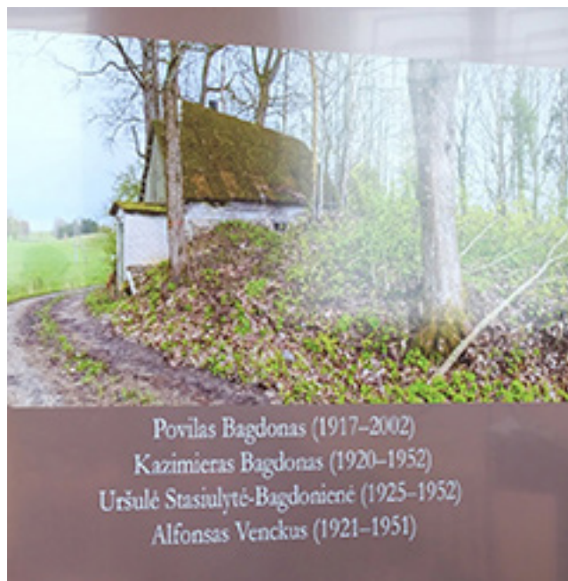
Žmonės, gyvenę bunkeryje

buvo pirtelės grindų lygyje. Įeiti į jį buvo galima pirtelės, nukėlus vieną sienos akmenį. Atsarginis išėjimas buvo lauko pusėje tarp medžio šaknų, tačiau, kaip teigiama, niekada nepanaudotas. Durelės