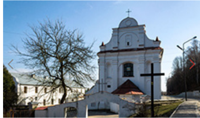
Seniausias išlikęs Mozyriaus miesto pastatas – buvusi Šv. arkangelo Mykolo bažnyčia ir bernardinų vienuolynas.

Po 1830–1831 m. sukilimo, kurio organizatoriai siekė atkurti unijinę Lietuvos ir Lenkijos vals-