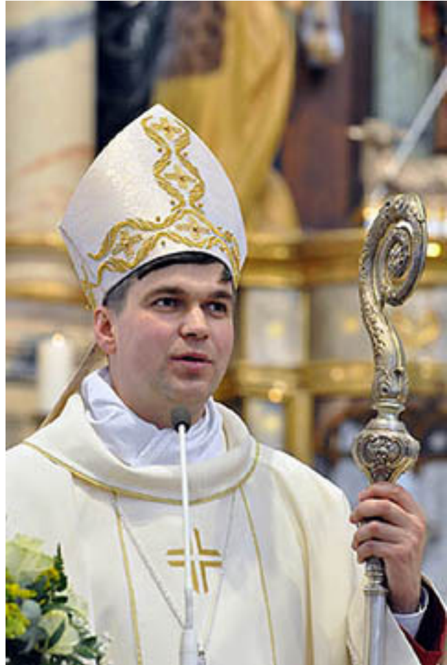
Vyskupas Genadijus Linas Vodopjanovas OFM. 2012 m. balandžio 14 d.