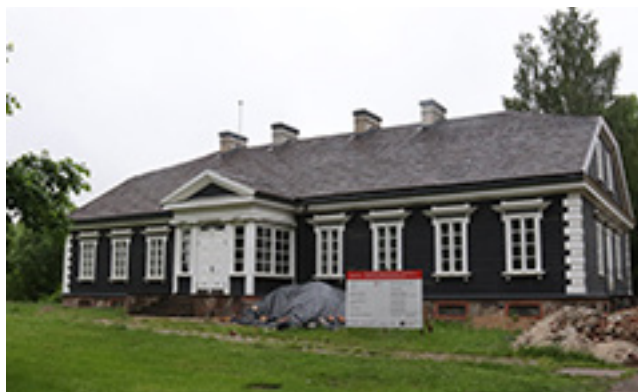
Atnaujintas vyskupo namas, kuriame M. Valančius gyveno, kai Žemaičių vyskupijos centras buvo Varniuose

altoriuje – 1417 m. Žemaičių vyskupui vyskupijos įkūrimo proga Vytauto dovanoto paveikslo („Trakų Dievo motina“) kopija. Paveikslas apkaustytas si-