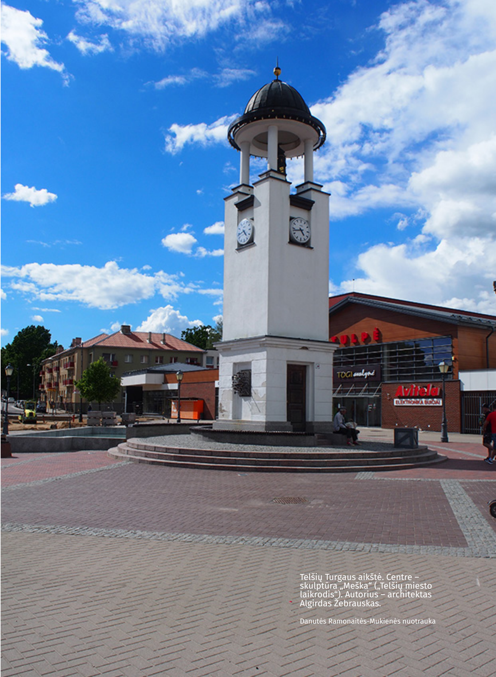
Telšių Turgaus aikštė. Centre – skulptūra „Meška“ („Telšių miesto laikrodis“). Autorius – architektas Algirdas Žebrauskas.