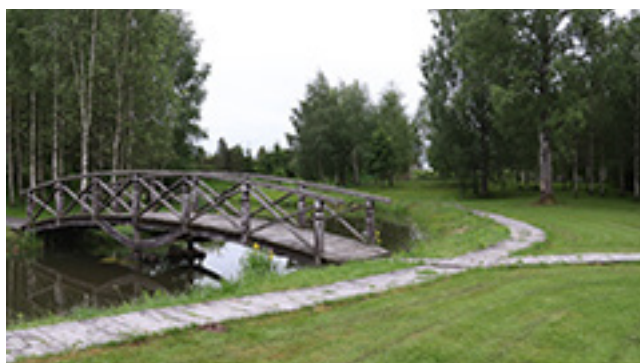
Auksinio elnio dvaro (Rapaliai, Telšių r.) sodybos fragmentai

gidei, pasivaikščioję po dvaro parką, išskubėjome į nakvynės vietą – Auksinio elnio dvarą, esantį Telšių rajono Rapalių kaime – už 5 km nuo Biržuvėnų.