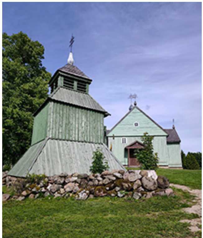
Kalnalio Šv. Lauryno bažnyčia (pastatyta 1777 m., 1882 m. vasarą trenkus žaibui, sudegė, 1883 m. atstatyta) ir varpinė.