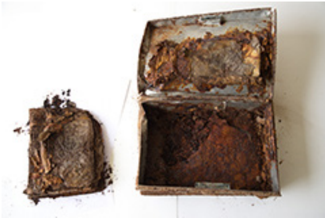
Dokumentų likučiai, rasti vykdant archeologinius tyrimus

iš vidaus buvo paremtos stulpeliu, tarp jų ir sienos įstatyti du išlenkti pjūklai. Bunkerio priešingose pusėse buvo įrengtos dvi ventiliacijos angos – viršutinė ir apatinė. Maskavimo tikslais virš bunkerio