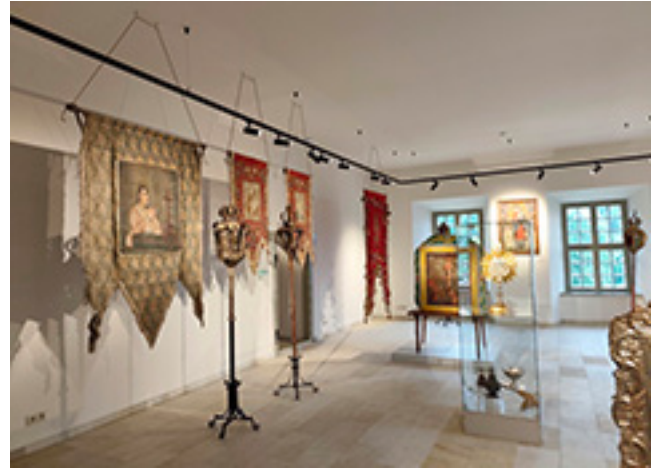
Žemaičių muziejaus „Alka“ ekspozicinio padalinio Žemaičių vyskupystės muziejaus Varniuose ekspozicijos fragmentas.

Žinia apie birželio 10–11 d. organizuojamą VŽKD ekskursiją „Po Žemaitiją Motiejaus Valančiaus keliais“ buvo pavišinta dar balandžio mėnesį, kai vyko draugijos renginys, skirtas Lietuvos Respublikos Seimo paskelbtiems Žemaičių vyskupo Motiejaus Valančiaus metams paminėti. Šioje dviejų dienų kelionėje (autobusu) maršrutu: Vilnius–Kretinga–Nasrėnai–Kalnalis–Biržuvėnai–Rapaliai–Telšiai–Varniai–Vilnius dalyvavo 51 vilniškis, norintis geriau susipažinti su M. Valančiaus gyveni-