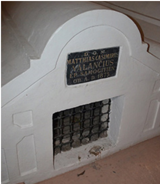
Vyskupo Motiejaus Valančiaus kapas Kauno Šv. apaštalu Petro ir Povilo arkikatedros bazilikos Vyskupų kriptoje.

Meniška brandžiausiu jo kūriniumi laikoma pirmą kartą 1869 m. išleista apysaka „Palangos Juzė“.