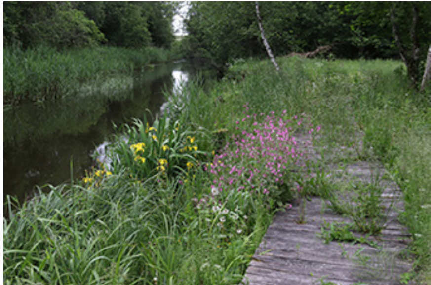
Jau žuolinā jem viršu... Vėngali Bonipaca portigrapiji

Bova, ka isibīgiejuom, Pīrštās tūp i žemis diejuom, Spīriem tūp i akminoka, Ka pīrštukū iš viršūnis