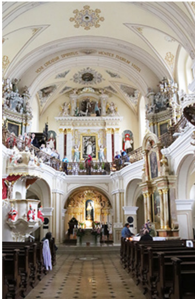
Telšių Šv. Antano Paduviečio katedros vidus