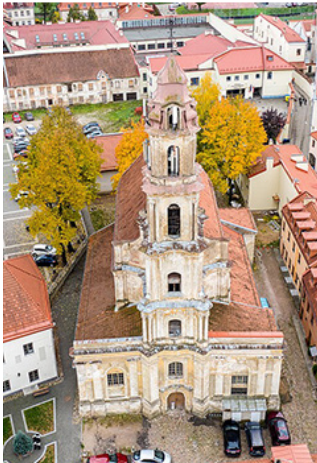
Švč. Mergelės Marijos Ramintojos bažnyčia, kur XIX a. buvusiame augustijonų vienuolyne glaudėsi Vilniaus vyriausioji kunigų seminarija.

ir iš karto įstojo į antrąją gimnazijos klasę. Žemaičių Kalvarijoje dominikonai gimnazistams lenkiškai dėstė tikybą, prigimtine teisę, antikinę istoriją, senovės geografiją, retoriką, poeziją, matematiką, fiziką, kitus gamtos mokslus. Mokiniam per pamokas, o ir bendraujant tarpusavyje, buvo leidžiama kalbėti tik lenkiškai. M. Valančius savo prisiminimuose rašo: „Profesoriai (mokytojai) turėjo teisę būti mokinių teisėjais ir budeliais. Kiekvienas buvo viešpats, neprivalęs niekam atsiskaitinėti. Nė vienas mokinys, nors kažin kaip gerai buvo išmokęs, kas užduota, negalėjo būti tikras, kad jo mokykloje nenuplaks, nes tai priderėjo ne nuo to, moki ar nemoki, bet nuo to, piktas ar nepiktas bus kunigas profesorius.“