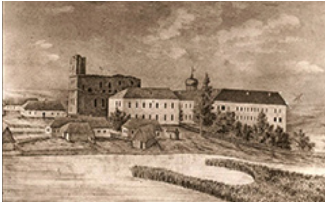
1840 m. Vincento Misevičiaus nutapytas Kražių kolegijos, veikusios 1614–1844 m., vaizdas (jėzuitų kolegija ir Švč. Mergelės Marijos Ėmimo į dangų bažnyčios griuvėsiai).

namos „gerai“, o lotynų kalba ir iškalba – „puikiai“.