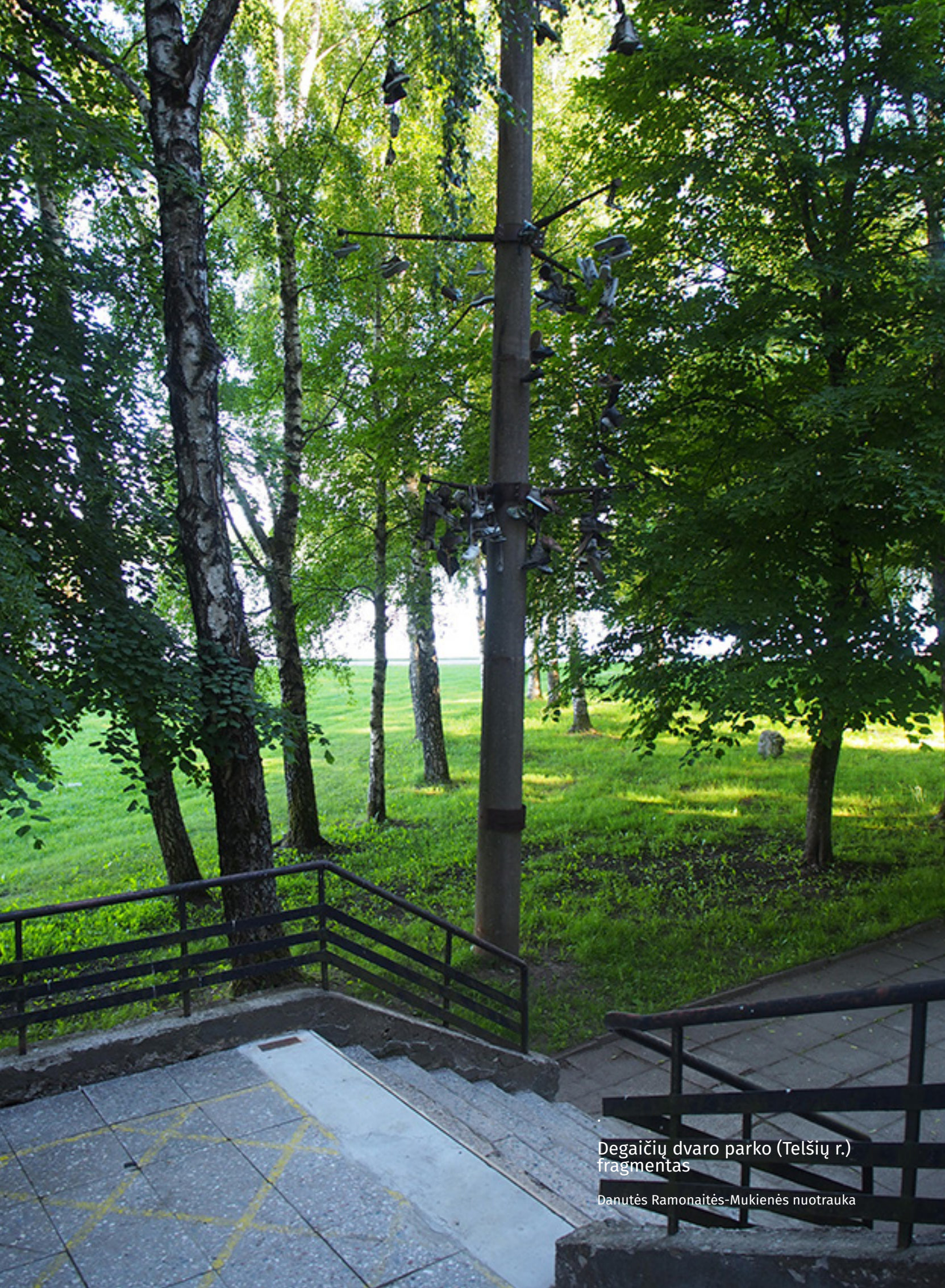
Degaičių dvaro parko (Telšių r.) fragmentas