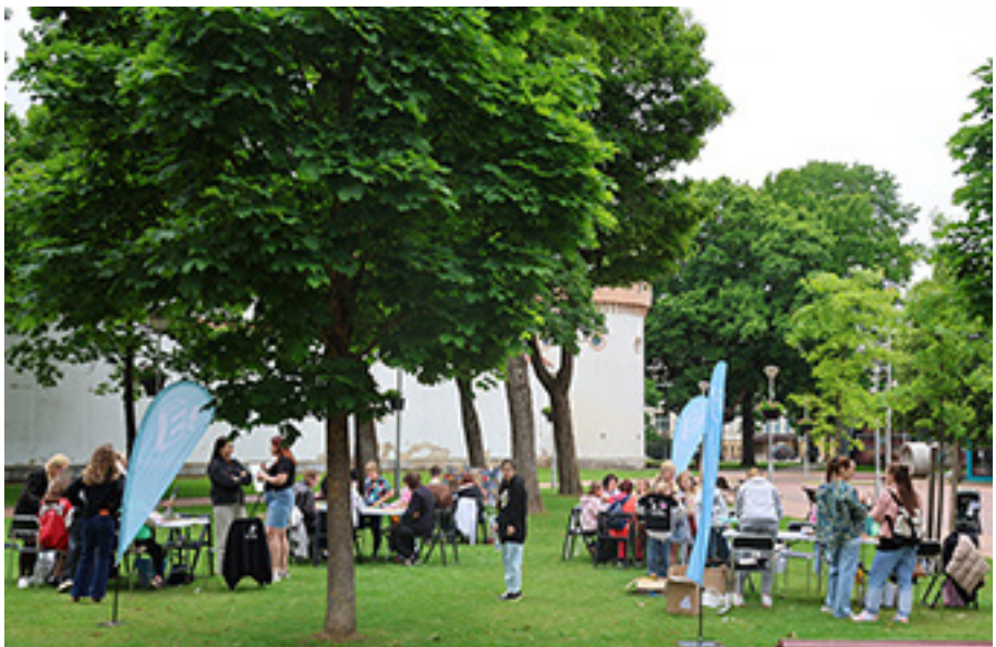
Birželio 18 d. vykusio renginio akimirka