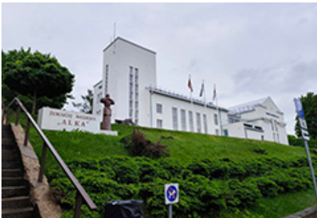
Nesenai renovuotas Žemaičių muziejaus „Alka“ pastatas ir čia veikiančios nuolatinės ekspozicijos fragmentas

tijos etnografiniame regione. Jo fonduose saugoma daugiau kaip 60 000 istorijos, archeologijos, etnografijos, profesionaliosios dailės ir liaudies meno, numizmatikos eksponatų, dokumentų, taip pat jų ir turtinga XVI–XX a. dvarų kolekcija, čia patekusi