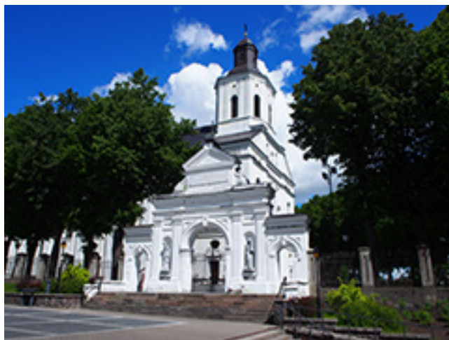
Telšių Šv. Antano Paduviečio katedra.