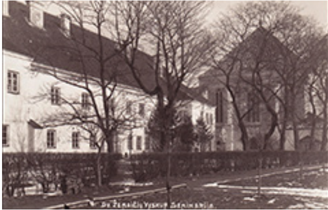
Į Kauną perkeltos Žemaičių kunigų seminarijos pastatas XX a. pradžioje.

mokinių 3 . Vėlesniais metais švietimas kai kuriose Žemaitijos parapijose taip pakilo, kad buvo net tokių, kuriose nebeliko beraščių (pvz., Rietave).