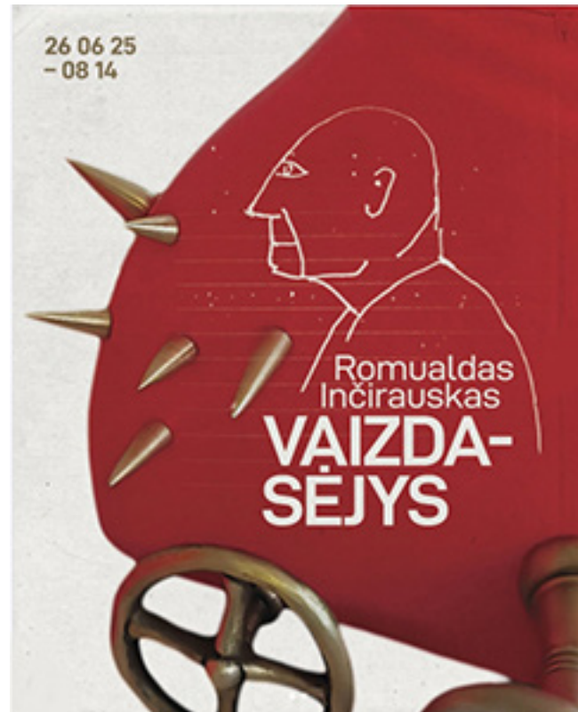
Parodos reklaminis plakatas