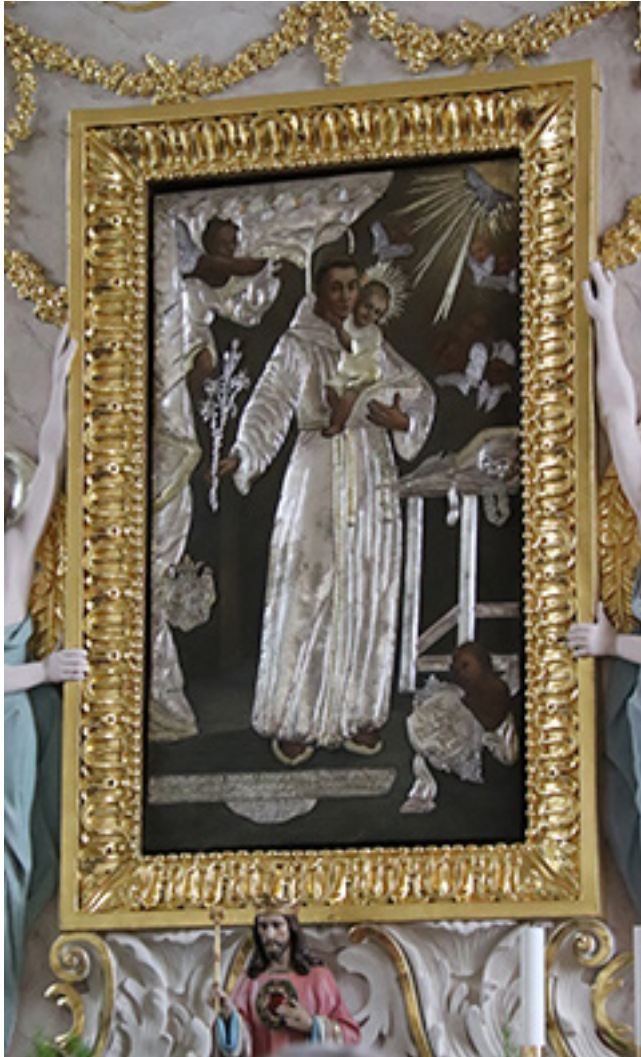
Šv. Antano Paduviečio paveikslas Telšių katedroje

kilmingai perlaidoti Telšių Šv. Antano Paduviečio katedros Vyskupų kriptoje.