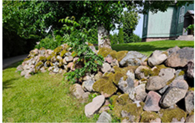
Nebylūs istorijos liudininkai. Kalnalis. 2026 m.