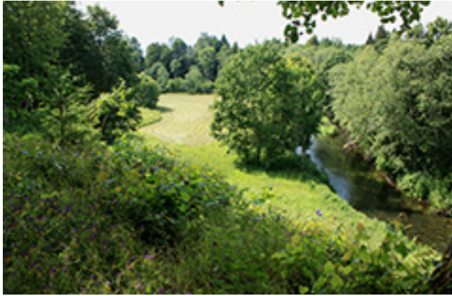
Vēngalē Bonipaca portēgrapējē

liuob soktēis pri prīstata statībā skērtuos medžeguos. Ka oušvis bova ē sens, ons nenuoriejē būtē nu vēskuo nuošalie. Anam vākus jau maž bereikiejē priveizietē, tad ons vēina dēina Sēmuonou ē saka: