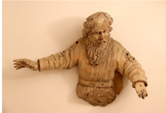
Šventojo skulptūros fragmentas ŽMA Varnių vyskupystės muziejuje

M. Valančius, užaugęs ant tokių tvirtų lietuviškų pamatų, tautos dvasią kėlė ne vienam savo auklėtinui. Kuklus klierikas Antanas Vienažindys, kuris mokėsi Varniuose M. Valančiaus rektoriavimo lai-