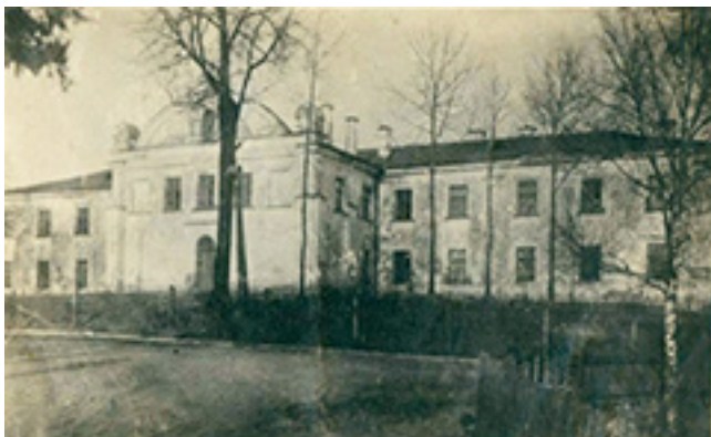
Buvęs Varnių dvasinės seminarijos pastatas XX a. 3 deš.

Tėvams apsisprendus sūnų išleisti į kunigus, Motiejus 1916 m. išvyko mokyti į Žemaičių Kalvarijoje veikusią šešių klasių dominikonų gimnaziją