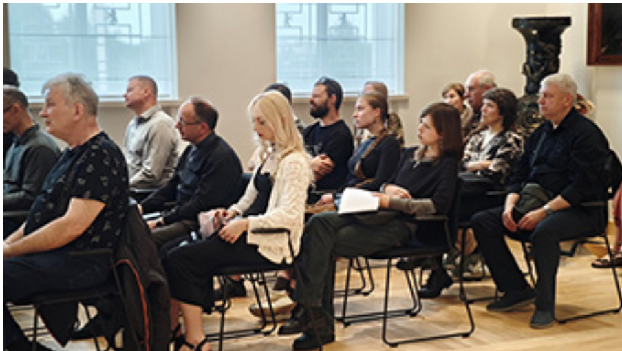
Grupė baigiamųjų darbų gynime dalyvavusių studentų ir jų dėstytojų

Atidarius Vilniaus dailės akademijos baigiamųjų darbų parodą, birželio 4–5 dieno-