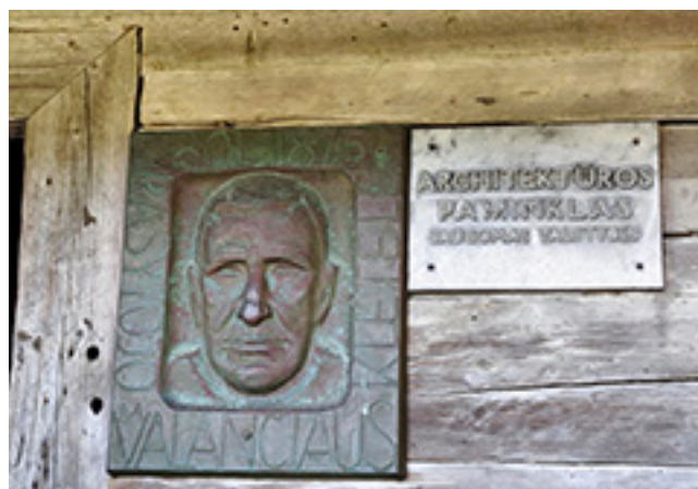
Nu vėršaus: Vīskopa M. Valončiaus gimtėnės moziejaus ekspuoziċėjuo – išleistas M. Valončiaus kningas; memuorialėnė lėnta ont klietelės, katruo ĩ gīvenės M. Valončius