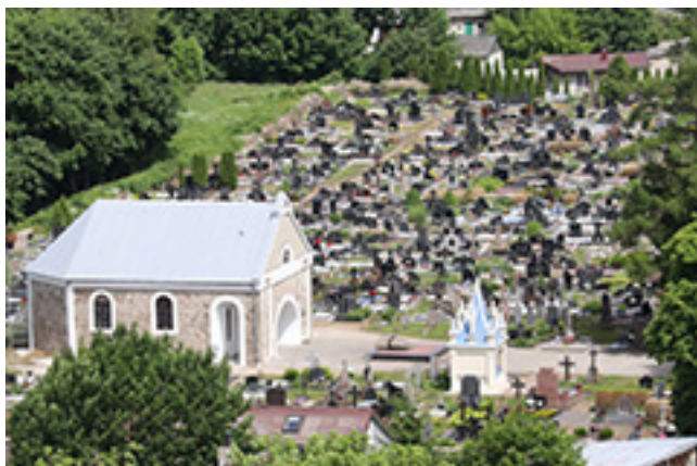
Iš kairies: Kretinguos senuosēs kapėnēs, esontēs Vėlniaus gatvės vakarėnie posie ēr rītėnie posie