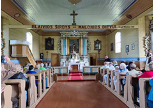
Kalnalis, Šv. Laurina bažničė