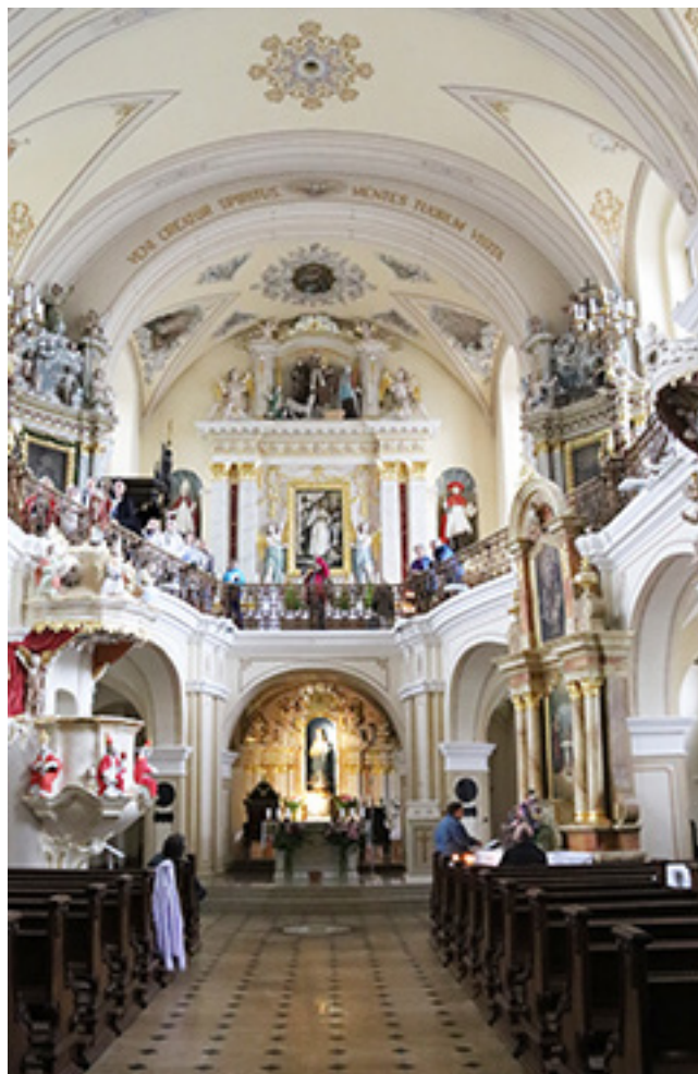
Telšių Šv. Antano Paduviečio katedros vidus

1940 m. Telšių katedroje vyskupu buvo konsekruotas prelatas Vincentas Borisevičius (1887–