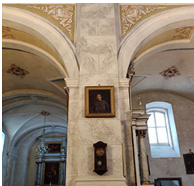
Varnių Šv. apaštalų Petro ir Pauliaus bažnyčios (buvusios katedros) vargonai ir interjero fragmentas