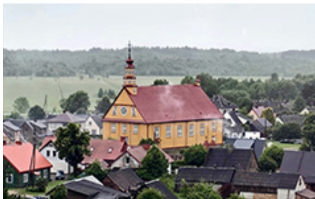
Varnių Šv. Aleksandro bažnyčia

Prieš atsisveikindami su svetingais Varniais buvome užsukę ir į miestelyje stovinčią 1770 m. Žemaičių vyskupo Jono Dominyko Lopacinskio