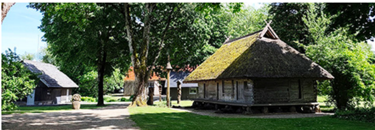
Vīskopa Motiejaus Valončiaus gimtuoji suodība