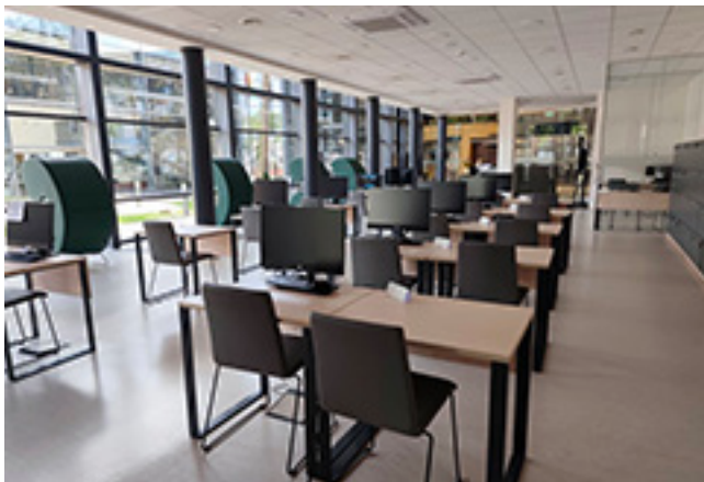
Iš kairies: bibliotekuo skaitītuoju ērdvius patalpuos tor galēmībē pasēnauduotē kompiuterēs; aki patraukē kningas aple M. Valončio ēr parudēlie bovossēs seniau išleistas anuo kningas