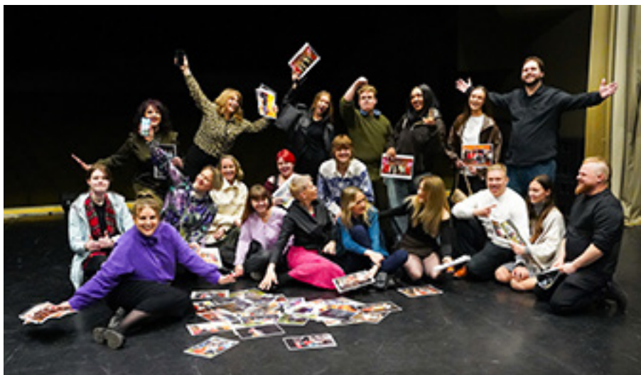
„Visavi“ aktoriai puikiai jaučiasi scenoje...

Tekstas parengtas pagal „Visavi“ informaciją