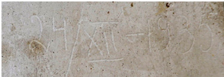
Simono Daukanto biustas ir jo nugarinės pusės įrašas.