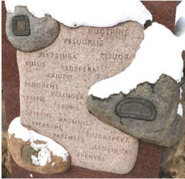
Dēdžiuojuo Žemaitiu sėinuo – žemaitiu kalbā skērta pluokštē. Telšē, 2025 m. sausē 5 d.

Pavardies nu žmuogaus naatimsi. Vo gīvenamuo-