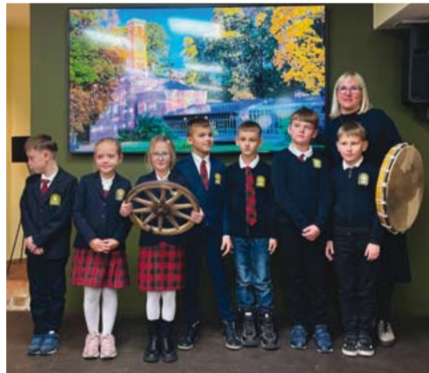
Karmanskienē Gitana ēr anuos ontruokelē.

Lėipėju muokīklas Plateliu skīrios itraukē 40 dalīviu, Šateikiu skīrios – 46, Žemaitējēs kadetu gimnazėjē (Alsiedē) – 79, Žemaitējēs kadetu gimnazējēs Žemaitiu Kalvarėjēs skīrios – 17, Koliū – / Aduolfa Jocē pruogimnazėjē – 23, „Ryta“ pagrindēnē muokīkla – 36, „Saulēs“ gimnazėjē – 100, vo vēsūm daugiau – net 543 vākā – ēš Plungēs Senamiestē muokīklas!