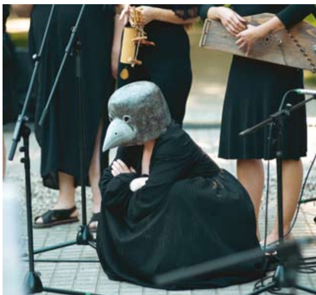
Fantasmagorišką atmosferą kūrė keisčiausi „instrumentai“.