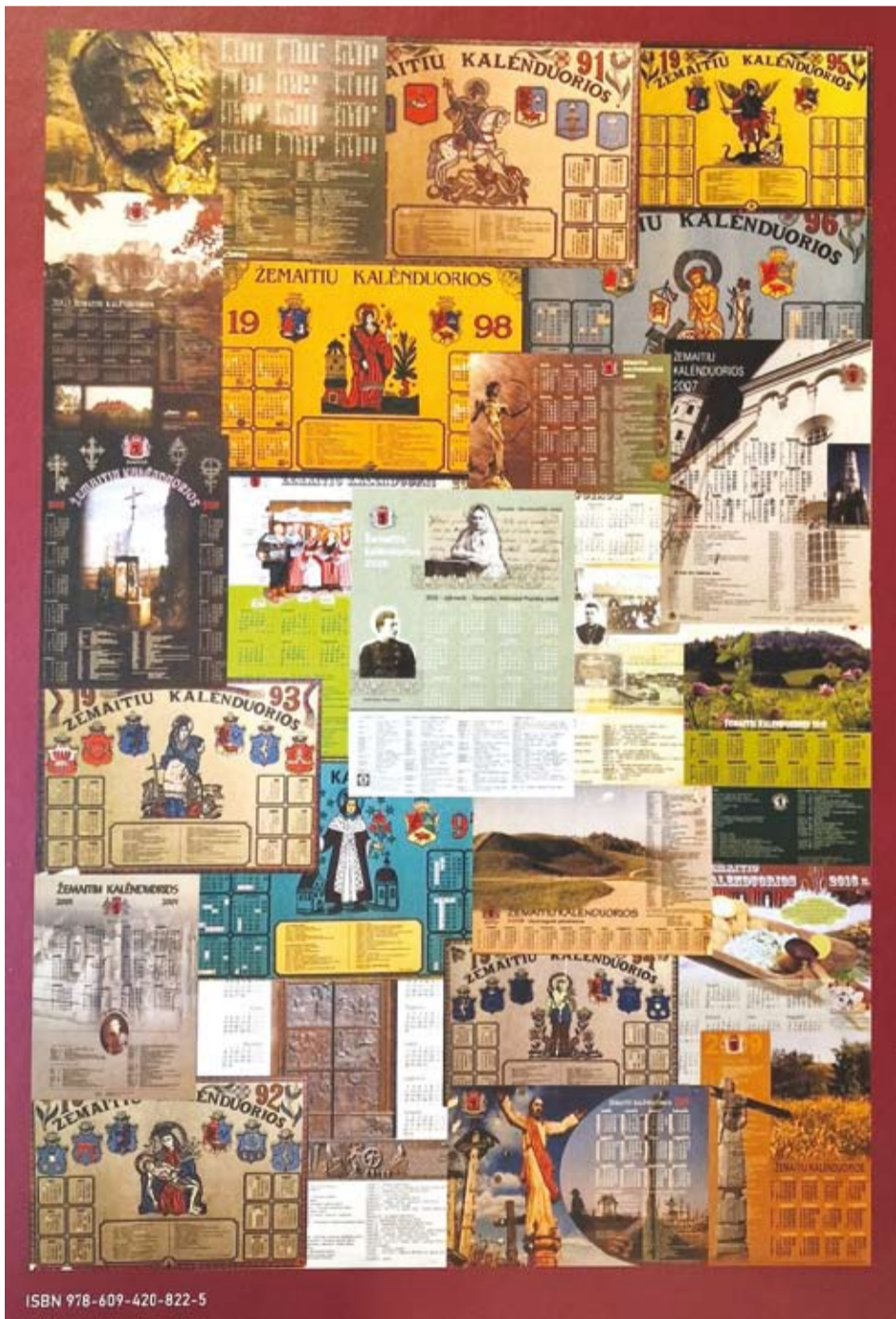
„Saulaukė“ 35-metiou – 35 žemaitėškė kalėnduorė (leidėnė iliustracėjė).