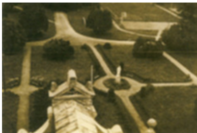
Vilkėno dvaro parko parterio fragmentas. XX a. pr. Fotografas nežinomas. Dešinėje – Vilkėno dvaro sodyba iš paukščio skrydžio 1952 metais. Fotografas nežinomas. Fotoreprodukcijos iš RKIC archyvo