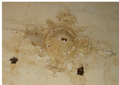
Vilkėno dvaro rūmų vidaus interjerų fragmentai. 2008 m.