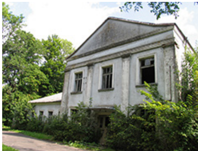
Nykstantys Vilkėno dvaro sodybos pastatai 2008 m. Apačioje – 1958 m. rekonstruotos, mokyklos veiklai pritaikytos dvaro arklidės.