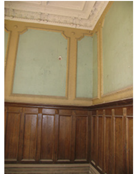
Vilkėno dvaro rūmų vidaus patalpų ir interjerų fragmentai 2008 m.

ilgą laiką tinkamai neprižiūrėtas, labiau į senstantį, krūmais užželiantį mišką tada buvęs panašus dvaro sodybos parkas.