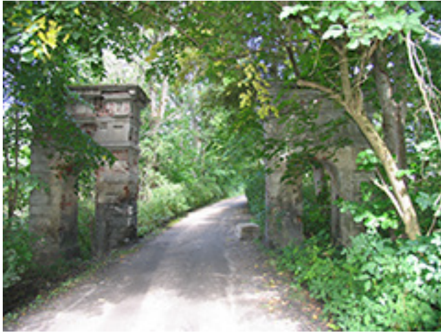
Vilkėno dvaro sodybos vartai 2008 m.