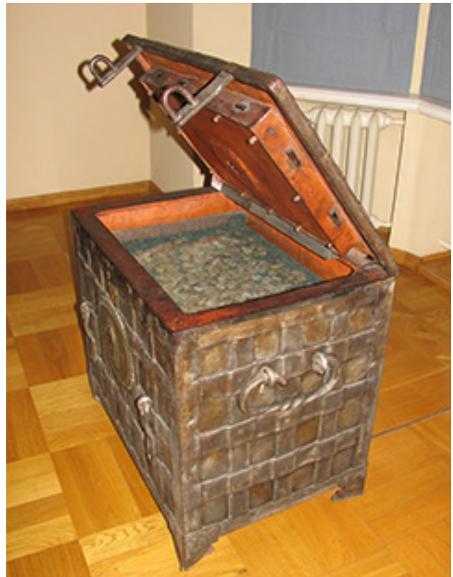
Ekspozicijoje Girkautų lobis XIX a. pab.–XX a. pr. pagamintoje Šaukėnų Gorskių dvaro kasos skrynioje. SAM I–D 508