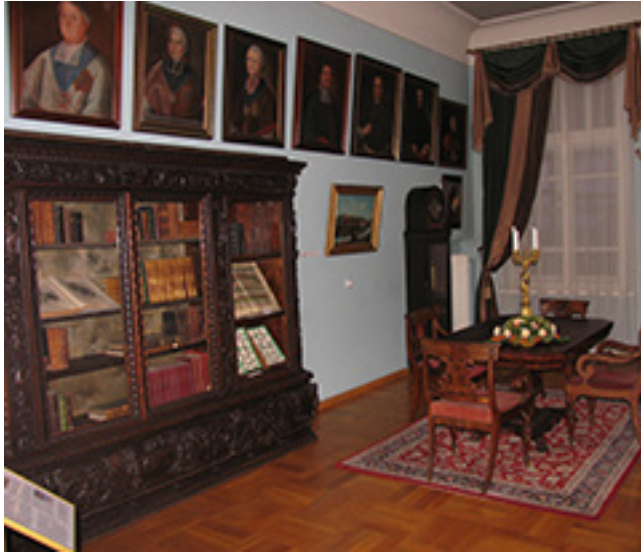
Ekspozicijos „Provincijos dvaras ir miestas XIX a. – XX a. vid.“ Bibliotekos salės fragmentas.

(1827–1898) „Tėvų atsisveikinimas su jaunąja“, A. Ricci (1854–?) „Buitinė scena“ paveikslai, J.V. Genisson'o (1805–1860) „Barokinės bažnyčios vidurinioji nava“, dviejų G. Volpato (1732–1808) mūzų (antikinių skulptūrų) kopijos: „Komedijos mūza Talėja“ bei „Epinės poezijos mūza Kaliopė“, kt.