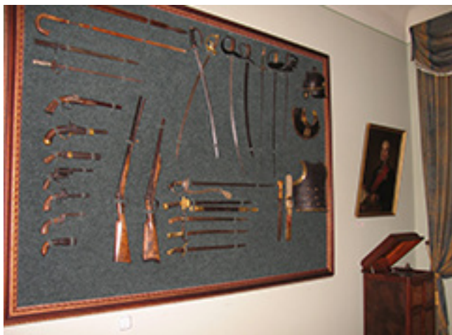
Šiaulių „Aušros“ muziejaus Ginklų rinkinio eksponatai ekspozicijoje „Provencijos dvaras ir miestas XIX a. – XX a. vid.“

šeimos narių apdovanojimai (iš viso 18), tarp jų ir 1928 m. vasario 27 d. V. Putvinskiui-Pūtviui įteiktas Italijos Karūnos ordinas. 6