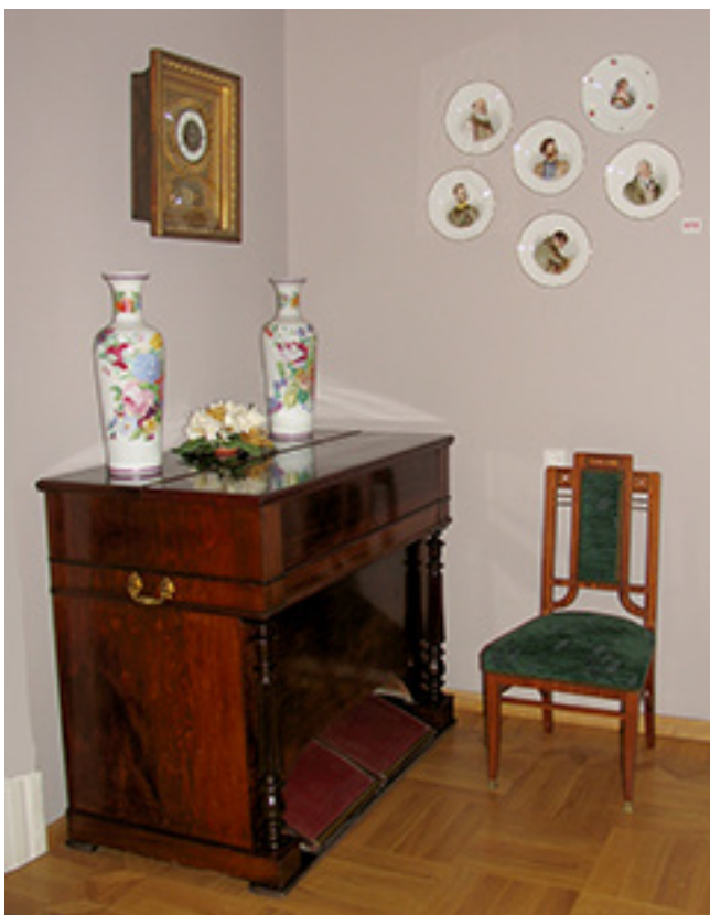
Porcelianas ir baldai iš Žemaitijos dvarų ekspozicijoje „Provencijos dvaras ir miestas XIX a.–XX a. vid.“

Dailės skyriaus rinkinius sudaro meno vertybės, muziejuje kaupiamos nuo jo įkūrimo 1923 m. iki šių dienų. Jame – apie 27 tūkst. liaudies, tautodailės ir profesionaliosios dailės eksponatų. Daug jų į šio skyriaus rinkinius pateko 1940–1941 m. iš nacionalizuojamų Šiaurės Lietuvos dvarų. Didelė jų