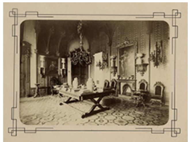
Beržėnų dvaro (Kelmės r.) kambarys. XIX a. pab. Fotografas Juozapas Romaškevičius. Nuotrauka saugoma Šiaulių „Aušros“ muziejuje, ŠAM F-IF205