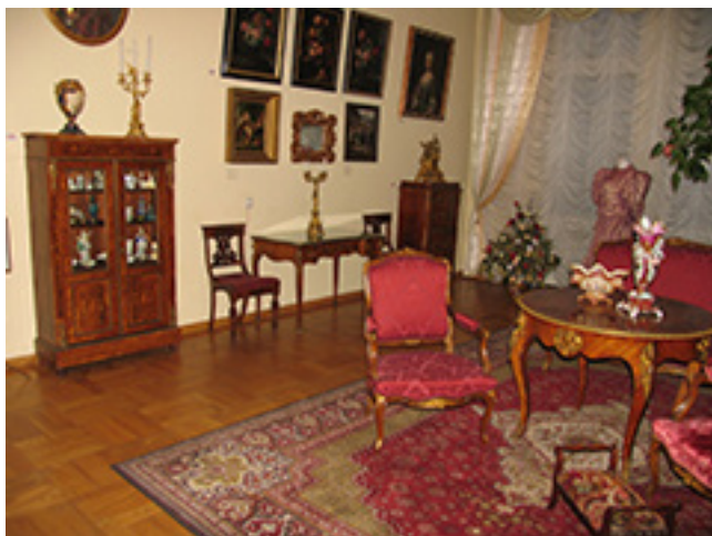
Iš kairės: ekspozicijos „Provincijos dvaras ir miestas XIX a.–XX a. vid.“ Geltonosios svetainės (moters kambario) fragmentas ir valgomojo salėje paserviruotas stolas.

porceliano fabrike. Rodomos ir brolių Kuznecovų fabrike XX a. pr. sukurtos penkios dekoratyvinės lėkštės. Jose pavaizduoti Nikolajaus Vasiljevičiaus Gogolio poemos „Mirusios sielos“ veikėjų portretai. Vidury kambario – pagal ano meto mados ir etiketo reikalavimus paserviruotas stolas. Ant jo – XIX amžiaus pirmos pusės Sevro porceliano manufaktūroje sukurtas itin puošnus pietų servizas, dekoruotas azūriniais ir auksu tapytais augaliniais motyvais baltame fone ir aukso raidėmis įrašytomis monogramomis „JSJ“.