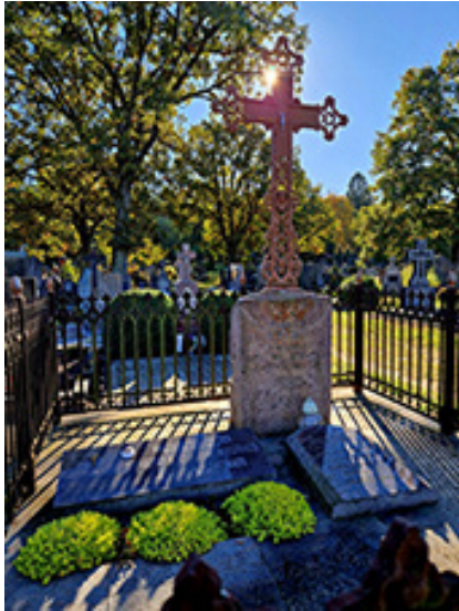
Maironio tėvų ir seserų amžinojo poilsio vieta Betygalos kapinėse (Raseinių r.). 2024 m.