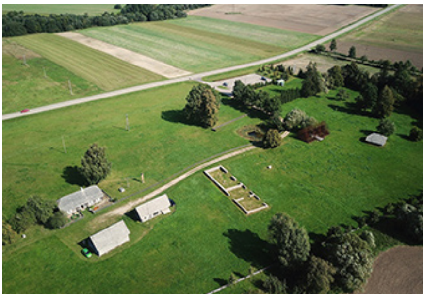
Bernotų viensėdis 2023 m. Iš buvusių 10 pastatų yra likę tik 4.

kambariai, didelė virtuvė, namo viduryje – darbo priemenė, kamino pakūra ir švarusis prieškambaris su gonkomis. Pastogėje, virš namo darbinės dalies, buvo salkutė, iš kurios atsiverdavo visas sodo gražumas.