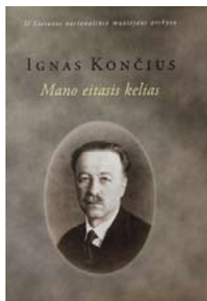
Vėlnios: Lietovuos naciuonalėnīs muziejos; 2016 m.