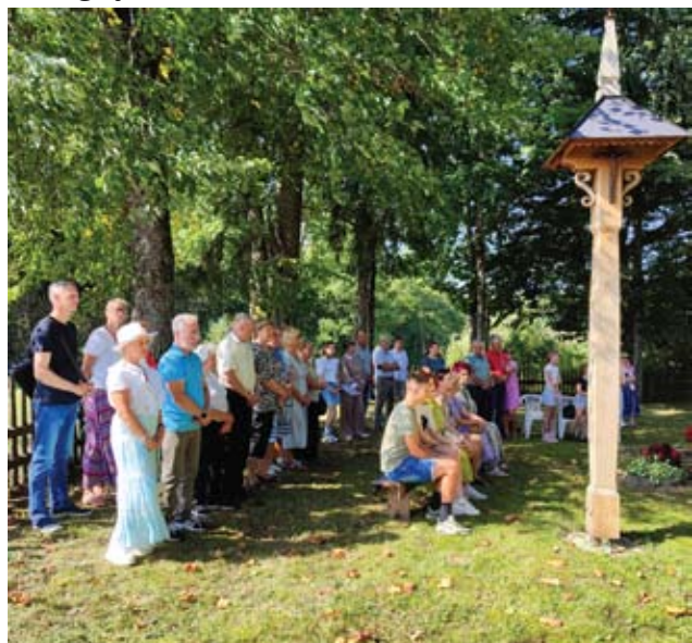
Į kapines susirinko gausus būrys vietos gyventojų ir svečių.