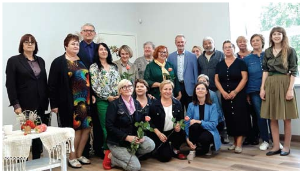
Plungės rajuna bėbliuotekėninkės so svetės.