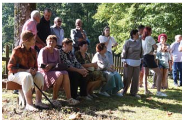
Į kapines susirinko gausus būrys vietos gyventojų ir svečių.