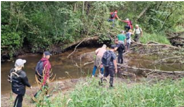
Žigėivė brend pas Sausdrava.