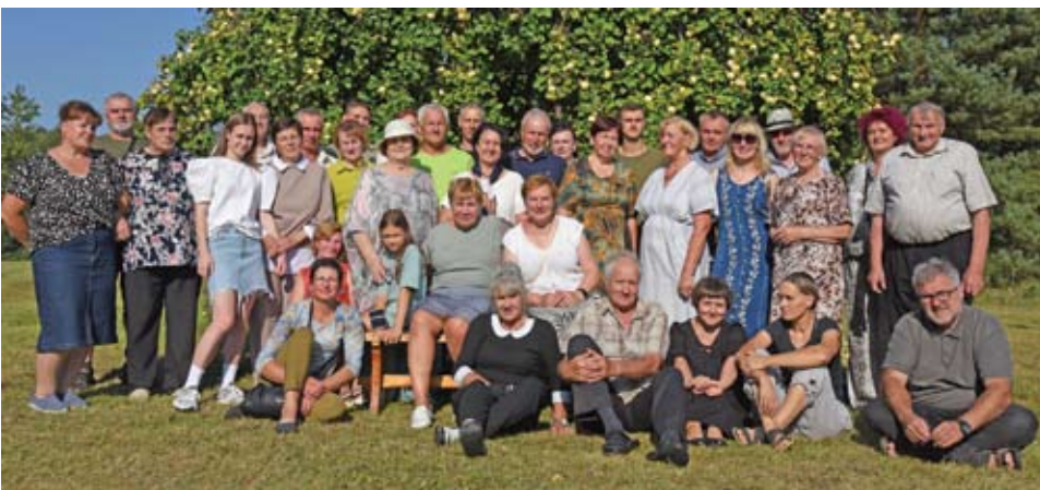
Šventės dalyviai, suvienyti bendrų vertybių ir kaimo istorijos.