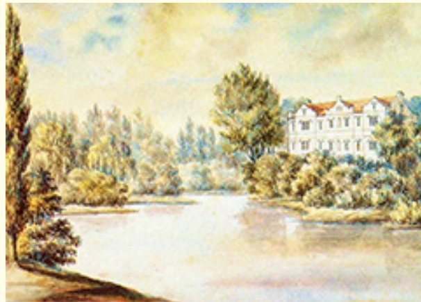
Kretingos dvaro sodyba. 1874–1875. Dailininkas Napoleonas Orda (1807–1883). Kūriniai saugomi Krokuvos nacionaliniame dailės muziejuje.

Kretingos dvaro sodyba – viena gražiausių, geriausiai paskutiniaisiais dešimtmečiais tvarkomų ir dažniausiai lankomų sodybų Žemaitijoje bei visoje Lietuvoje. Ji suformuota XVIII–XIX a., o pats dvaras įkurtas XVI amžiuje. Iš pradžių Kretingos valda priklausė Žemaičių seniūnams Kęsgailoms, vėliau – Lietuvos didžiajam maršalkai, Žemaičių seniūnui ir Livonijos valdytojui Jonui Jeronimui Chodkevičiui, didikams Sapiegoms, Masalskiams, Potockiams, Zubovams, o 1875 m. šį dvarą varžytinėse nusipirko grafas Juozapas Tiškevičius (1835–1891). Tais pačiais metais jis savo šeimos rezidenciją pradėjo iš Lentvario perkelti į Kretingą. Rūmų patalpos buvo įrenginėjamos 1878–1880 metais. Su grafo Juozapo Tiškevičiaus ir jo sūnaus Aleksandro Tiškevičiaus (1864–1945), kurie buvo paskutiniai Kretingos dvaro valdytojai, vardu yra siejamas dvaro suklestėjimas ir naujausių ūkininkavimo bei techninių naujovių įdiegimas jame XIX a. pab.–XX a. pr.