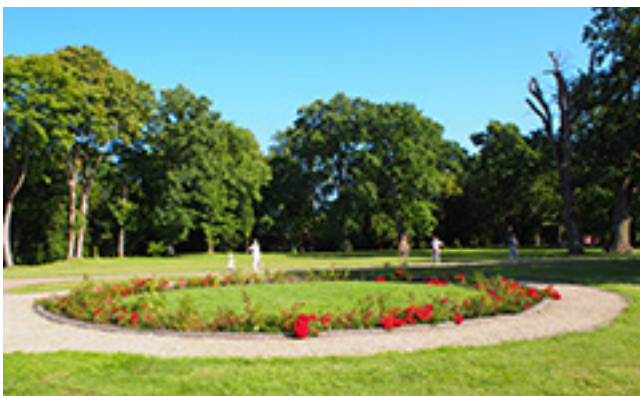
Kretingos dvaro rūmų, oranžerijos ir parko fragmentai. 2023 m.