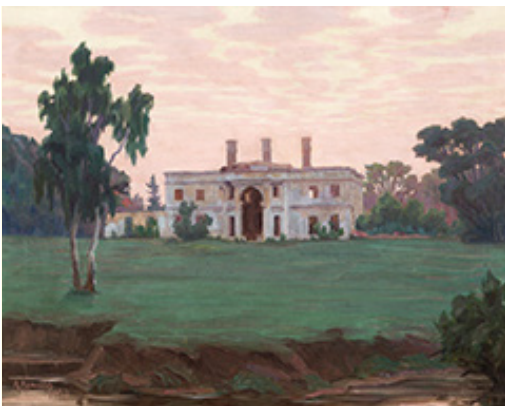
Paveikslas „Jurbarko dvaro griuvėsiai“. 1927 m. Dailininkas Antanas Žmuidzinavičius. Kūrinys saugomas Nacionaliniame M. K. Čiurlionio dailės muziejuje, ČDM Ž 56; tų pačių dvaro rūmų, kuriuos Pirmojo pasaulinio karo metais sudegino vokiečių kariškiai, griuvėsiai 1915 m. balandžio 3 d.