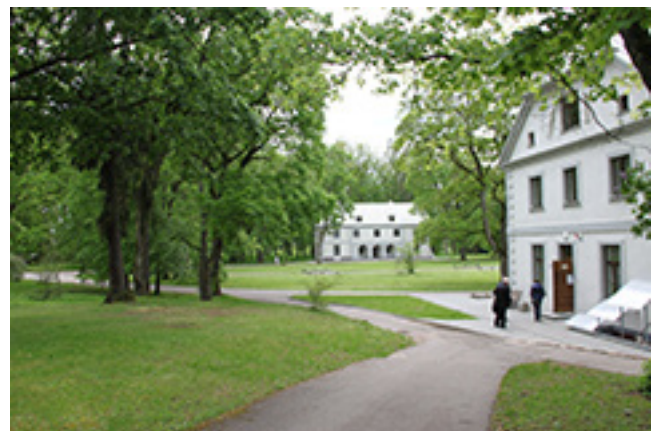
Jurbarko dvaro sodybos fragmentas. Dešinėje – restauruotos ofcinas.

Dvaro sodyboje yra išlikęs XIX a. vid. pastatytas kumetynas, antrieji dvaro sodybos vartai. 2015 m. atstatytos 1914 m. vokiečių sudegintų dvaro centrinių rūmų kolonos.