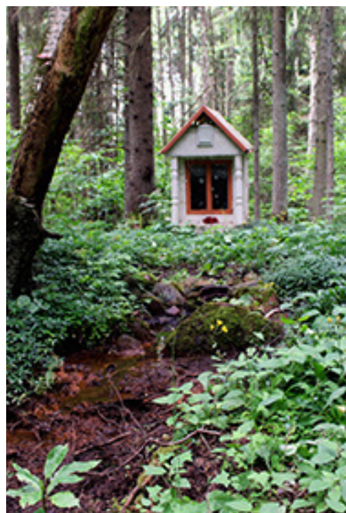
Račių alkakalnio koplytėlė ir Gyvasis šaltinis