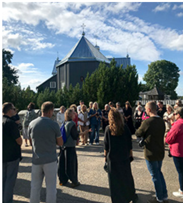
Prasidedant spektakliui žiūrovai rinkosi prie Užvenčio Šv. Marijos Magdaliėtės bažnyčios