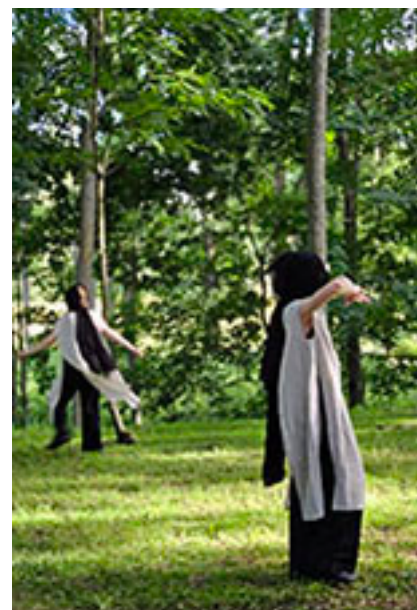
Spektaklio-ekskursijos „Soteria“ scenos Užvenčio dvaro parke