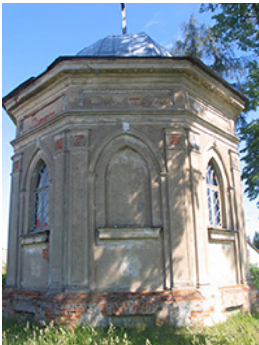
Romerių koplyčia-mauzoliejus Tytuvėnuose. 2007 m.