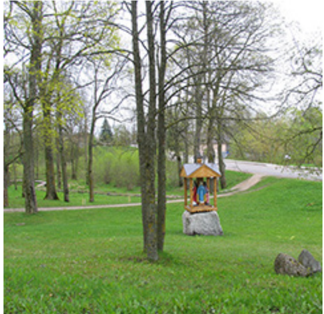
Užvenčio dvaro parko fragmentas.