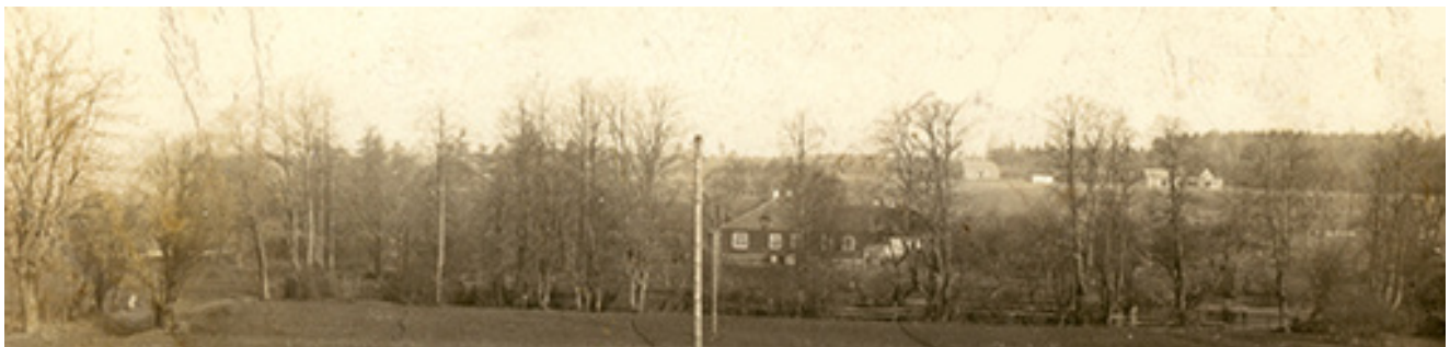
Pakražančio dvaras apie 1931-uosius metus.

1990 m. Lietuvai atkūrus nepriklausomybę, buvo pradėti tvarkyti, pilnai ar iš dalies restauruoti renovuoti minėtame sąraše buvę Kelmės, Pakėvio,