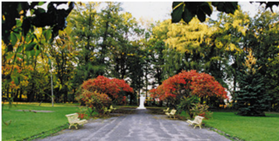
Pagryžuvio dvaro parko fragmentas. XX a. pab.