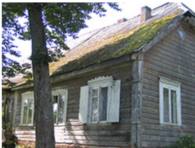
Išlynų dvaro gyvenamojo namo fragmentas.

krašto senuosius didesnius ir mažesnius dvarus, jų palivarkus, čia gyvenusius įžymius žmones. Kaip jau minėjo direktorė, dalies Kelmės rajono teritorijoje buvusių dvarų sodybų jau nebėra nei Kultūros vertybių registre, nei dabartinėje Kultūros paveldo centro Lietuvos dvarų duomenų bazėje. Daugelis jų jau yra visai sunykę arba jų sodybose yra likę tik nedideli čia stovėjusių pastatų, buvusių parkų fragmentai. Kai dvarai klestėjo (XIX a. II p.–XX a. pr.) keletas tų dvarų buvo pažangaus ūkininkavimo pavyzdžiai, svarbūs kultūros ir švietimo židiniai, neretai jų savininkai darė didelę įtaką valsčiaus ar net visos apskrities visuomeniniam ir kultūriniam gyvenimui, buvo žinomi ir už Lietuvos ribų.