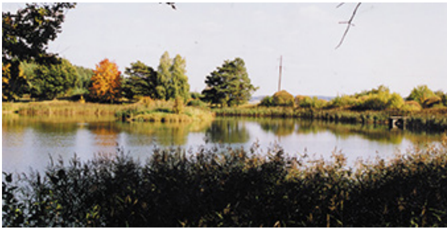
Beržėnų dvaro parko fragmentai.

vio dvaro kompleksas įtrauktas į Nekilnojamųjų kultūros vertybių registrą.