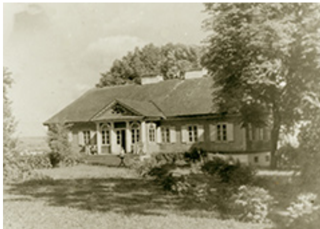
Tytuvėnėlių dvaro gyvenamasis namas 1938 metais.