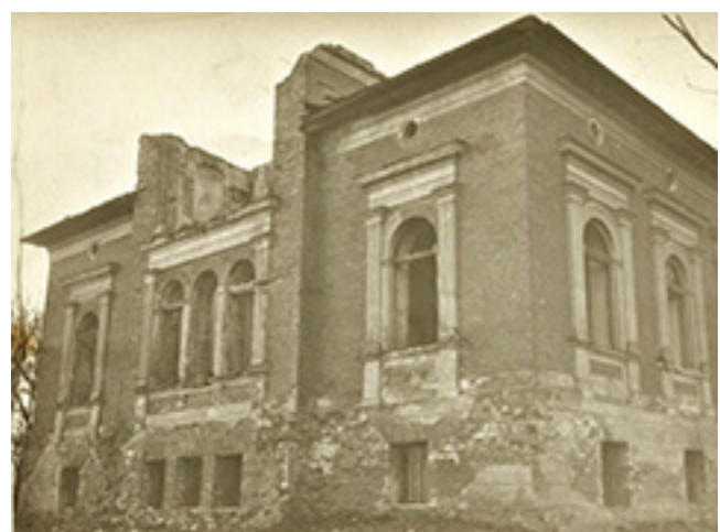
Iš kairės: restauruotas Pavandenės dvaro savininkų mauzoliejus-kolumbariumas (kripta). Pavandenės dvaro rūmų liekanos XX a. pabaigoje.