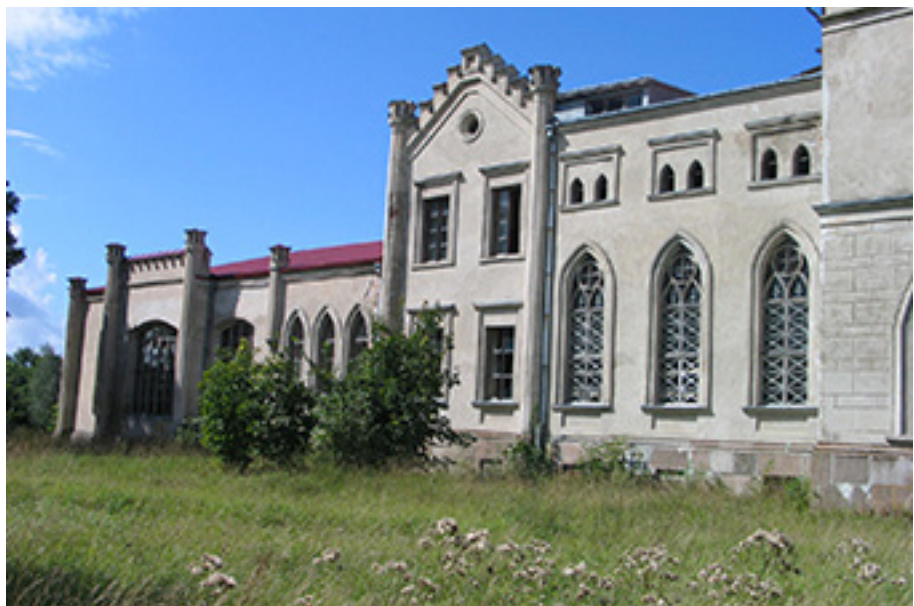
Beržėnų dvaro centriniai rūmai 2007 metais.

nyksta. Ypač sunku atkurti dvarų pastatus, jei jie privatizacijos laikotarpiu perėjo kelių žmonių nuosavybėn žmonių. Dabar dažnai jų valdytojai dėl vieno ir to paties pastato turi skirtingus planus, norus ir jų finansinės galimybės nevienodos. Tokiu atveju kaip taisyklė susitarti nepavyksta, darbai stringa, o vertingi buvusių dvarų pastatai, jų želdynai nyksta.