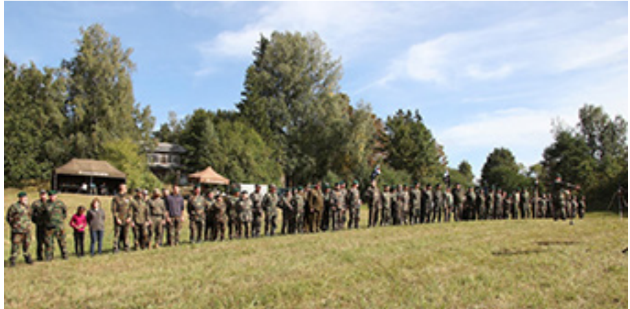
Tradicionis Lietuvos šaulių sąskrydis buvusio Graužikų dvaro teritorijoje.

Z. Petravičius mirė Kaune. Iš PAŠIAUŠĖS DVA-