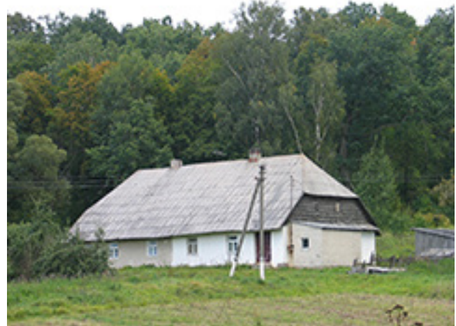
Iš kairės: buvusios Šilo Pavėžupio mokyklos pastatas; buvusio Grauzikų dvaro kumetyno gyvenamasis namas.

rolo Povilo Plechavičiaus ir pulkininko Aleksandro Plechavičiaus brolis. Šios dailininkės kūryba yra eksponuota daugelyje Jungtinėse Amerikos Valstijose (JAV) vykusių parodų, o jos paveikslų saugoma privačiose kolekcijose, muziejuose: M. K. Čiurlionio galerijoje Čikagoje, Žemaičių muziejuje „Alka“ (čia yra 133 jos ankstyvojo laikotarpio kūrinių).