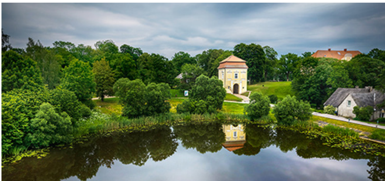
Kelmės dvaro sodybos fragmentas.