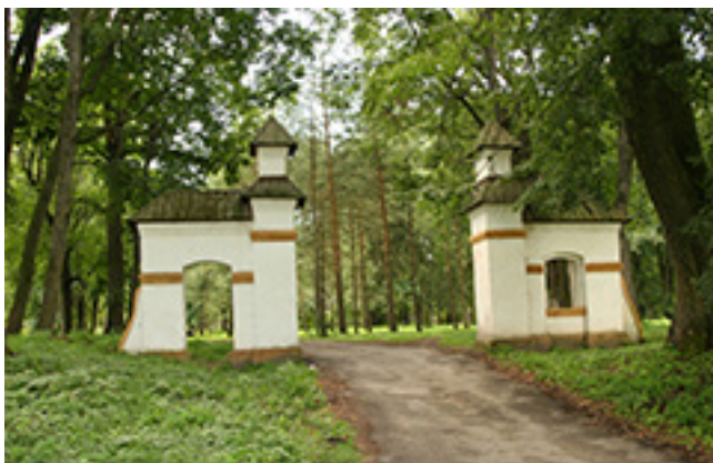
Buvusio Šaukėnų dvaro sodybos vartai.

Šaukėnų, Užvenčio ir Pagryžuvio dvarai. Savininkams pasikeitus šiek tiek buvo pradėtas tvarkyti gražios architektūros neogotikinio stiliaus XIX a. Beržėnų dvaras, bet netrukus darbai nutrūko ir dabar šio dvaro centriniai rūmai yra prastos būklės.