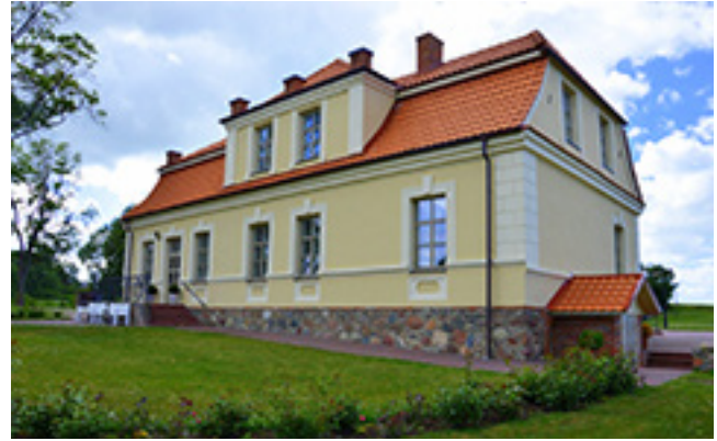
Iš kairės: Pakėvio dvaro pastatas 2004 metais. Nuotrauka Danutės Žalpienės; restauruotas Pakėvio dvaro pastatas 2019 metais. Fotografas nežinomas. Nuotrauka iš Kelmės krašto muziejaus archyvo

kilmės dailininkė meno žinovų yra vadinama akvarelės virtuoze, viena ryškiausių Lietuvos portretisčių ir peizažo meistrių.