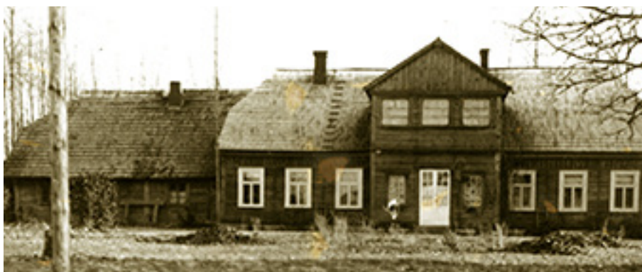
Adošiškės dvaro gyvenamasis namas 1935 metais.