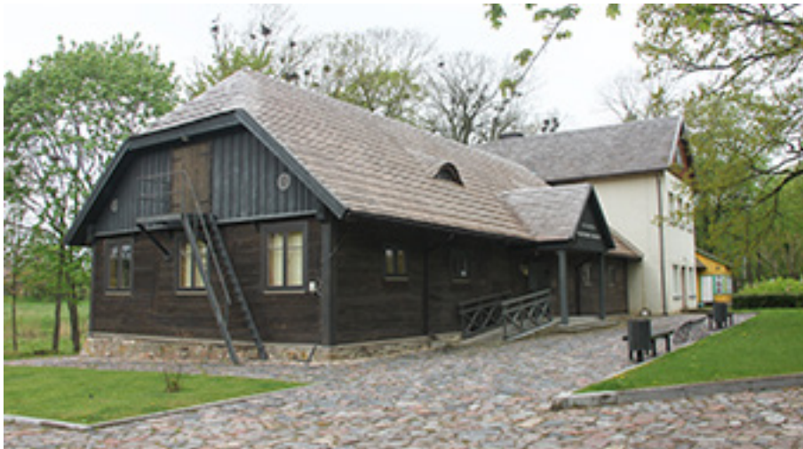
Restauruotas Užvenčio dvaro svirnas, kuriame dabar veikia Užvenčio kraštotyros muziejus (Kelmės krašto muziejaus padalinys). 2014 m.