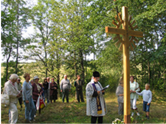
Kryžiaus šventinimas buvusioje Sirvydų dvaro sodyboje 2005 metais.