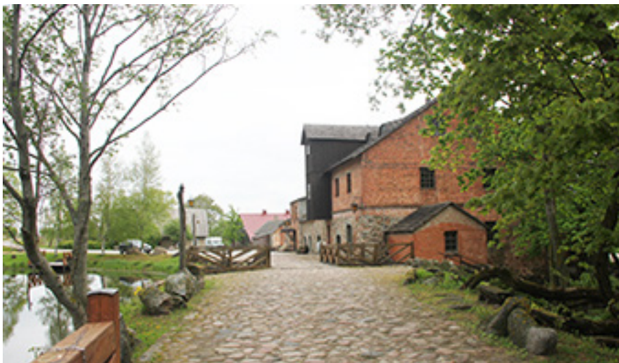
Renovuotas Užvenčio dvaro malūnas užtvenktos Ventos upės pakrantėje. 2014 m.

kuris buvo garsus ne tik Lietuvoje, bet ir už jos ribų. Tarpukario metais šiam ūkiui vien ariamos žemės priklausė 300 hektarų. Čia buvo auginami grynakraujai veisliniai gyvuliai, tvenkiniuose veisdavo žuvis, žemę apdirbdavo tuo laiku itin modernia technika. Dvaro teritorijoje veikė pieno perdirbimo bendrovė.