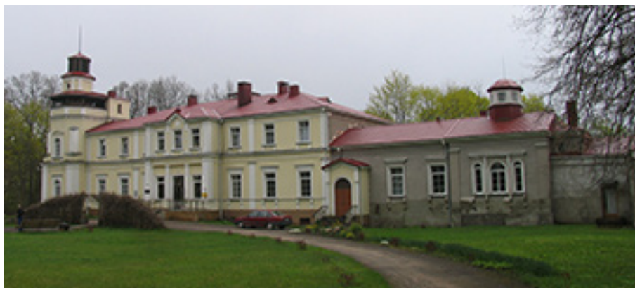
Pagryžuvio dvaro rūmai apie 2014 metus.