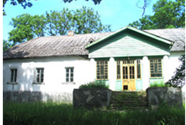
Pašiaušės dvaro gyvenamasis namas 2007 metais.