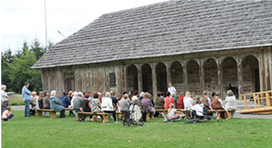
Prie atstatyto Kelmės dvaro svirno vyksta Žolinių šventės renginys. 2021 m. Kristinos Milašauskienės nuotrauka