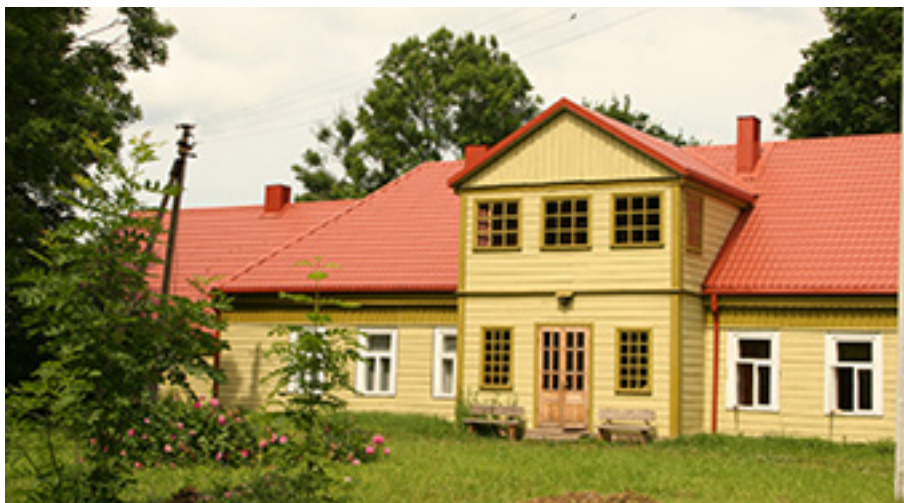
Restauruotas Adošiškės dvaro gyvenamasis namas. 2007 m.

PAVANDENĖS (SAKELINĖS) dvaras istoriniuose šaltiniuose minimas nuo 1553 metų. Jo sodyba buvo įsikūrusi labai gražioje vietoje – kalneliuose ant Gludo (Bludo) ežero kranto. Kitoje ežero pusėje stūkso Moteraičio piliakalnis. Pavandenės dvaras,