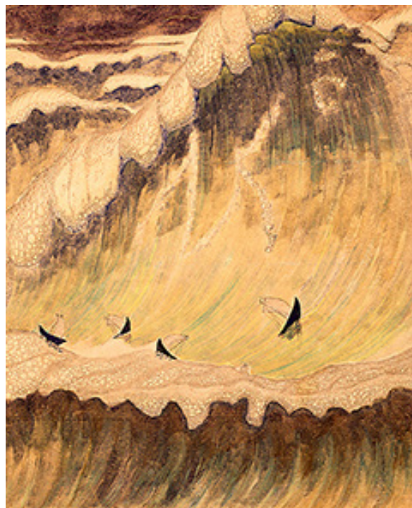
Mikalojaus Konstantino Čiurlionio paveikslas „Jūros sonata. Finale“. 1908 m. Originlas saugomas Nacionaliniame M. K. Čiurlionio muziejuje.