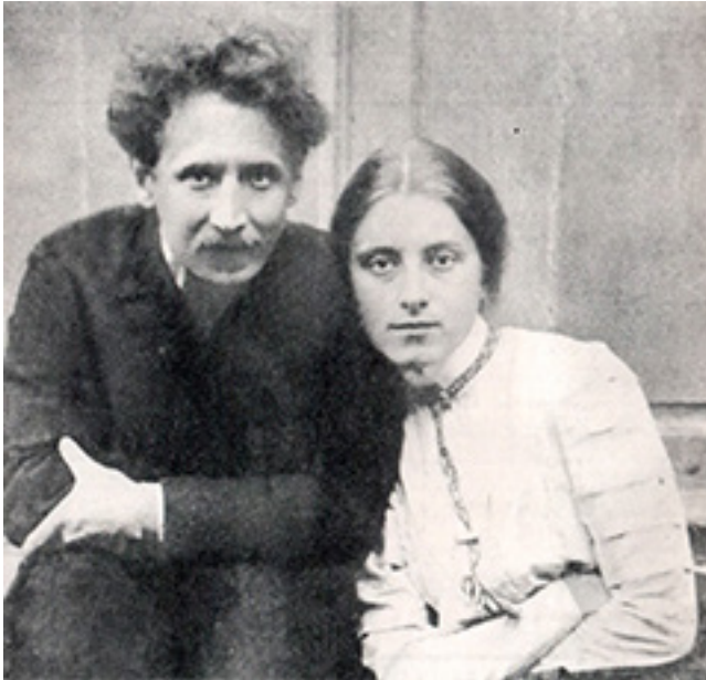
Mikalojus Konstantinas Čiurlionis ir Sofija Čiurlionienė-Kymantaitė.

nių papėdėse, kitose įsimintinosose vietovėse buvo rengiami bendri koncertai. Suprantama, kad, 1889 m. pradėjęs mokytis Plungės muzikos mokykloje, netrukus į šiuos išpūdingus muzikinius renginius įsijungė ir M. K. Čiurlionis. Pasak Oginskių istoriją tyrinėjantių Rietavo Oginskių kultūros istorijos muziejaus darbuotojų, „Rietave muzikantai ypač mėgo koncertuoti į pietryčius nuo rūmų virš ledainės rūsio įrengtoje muzikantų terasoje. Iš čia atsiverdavo pasakiški vaizdai ne tik į rezidencinių dvaro rūmų bokštų siluetus, oranžerijų arkadas, bet ir į parterio gėlynus, Lelijų tvenkinį, žydinčiais krūmais padabintas Jaujupio pakrantes. Pietvakarių pusėje už Malūno tvenkinio driekėsi Rietavo miesto su švytinčiais bažnyčios bokštais panorama. [...] Legenda virtę pasakojimai primena, kad abiejų orkestrų atsisveikinimo koncertai Rietave buvo rengiami ir vienoje iš Malūno tvenkinio salų. Neveltui jai prigijo Muzikantų salos vardas. Kitos trys Malūno tvenkinio salos Rietavo muziejininkų siūlymu yra pavadintos Ramybės, Aukuro ir Vakaro salų vardais. Visos jos sudaro bendrą M. K. Čiurlionio salų grupę. [...]