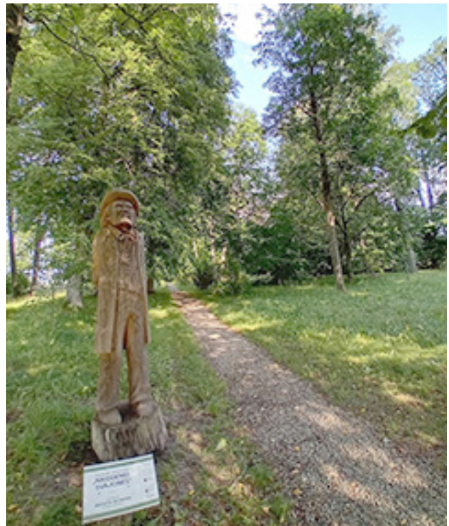
Iš ąžuolo išdrožta skulptūra „Nikodemo svajonės“ (dail. Kęstutis Butnoris) Paragių dvaro sodyboje

pažymėtą sodybą, čia užsukančių keliautojų. Džiugu, kad muziejuje, lydimi mokytojų, noriai lankosi, edukaciniuose užsiėmimuose dalyvauja vaikai ir jaunimas – Akmenės, Mažeikių, Telšių rajonų mokyklų auklėtiniai. Muziejuje veikia Kultūrinės