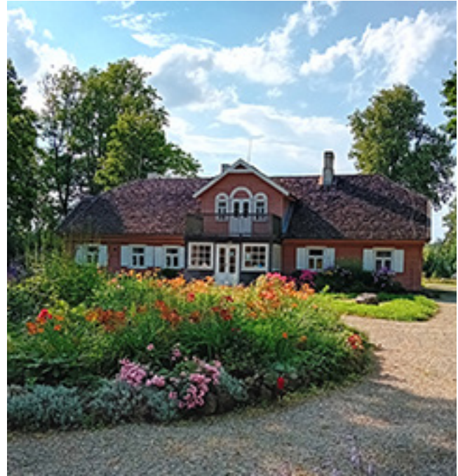
Paragių dvaro sodybos centrinis pastatas, kurime dabar veikia Akmenės krašto muziejaus padalinys Lazdynų Pelėdos memorialinis muziejus

– Šį sezoną, kaip ir kasmet, muziejuje sulaukiame ir turistų grupių, ir individualiai keliaujančių, iš anksto susipažinti su mūsų muziejumi suplanavusių ar spontaniškai, pamačius lankytino objekto ženklų