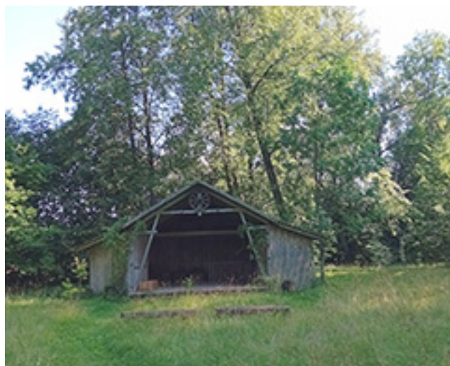
Nuotraukose (nuo viršaus): dvaro sodyboje veikianti, 1926 m. pastatyta dūminė pirtelė; Lazdynų Pelėdos memorialinio muziejaus klėtelė; parko scena, kurioje mėgsta slėptis pelėdos