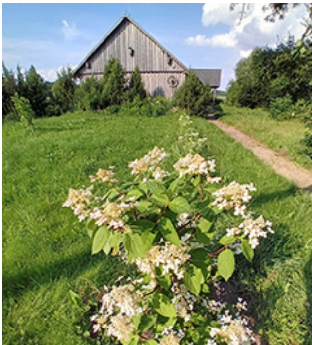
Klojimo teatro pastatas

edukacijos sistema, kurios pagalba per įvairius edukacinius užsiėmimus į muziejų pavyksta pritraukti ne tik lankytojų, bet ir lėšų. Sulaukiame ir specialiai senaisiais mūsų krašto dvarais besidominčių gyventojų. Be abejo, norėtusi pritraukti gausesnį būrį lankytojų, bet vasarą mums, esant tolokai nuo kurortų, sudėtinga konkuruoti su jūros ir paplūdimių išsiilgusiais keliautojais.