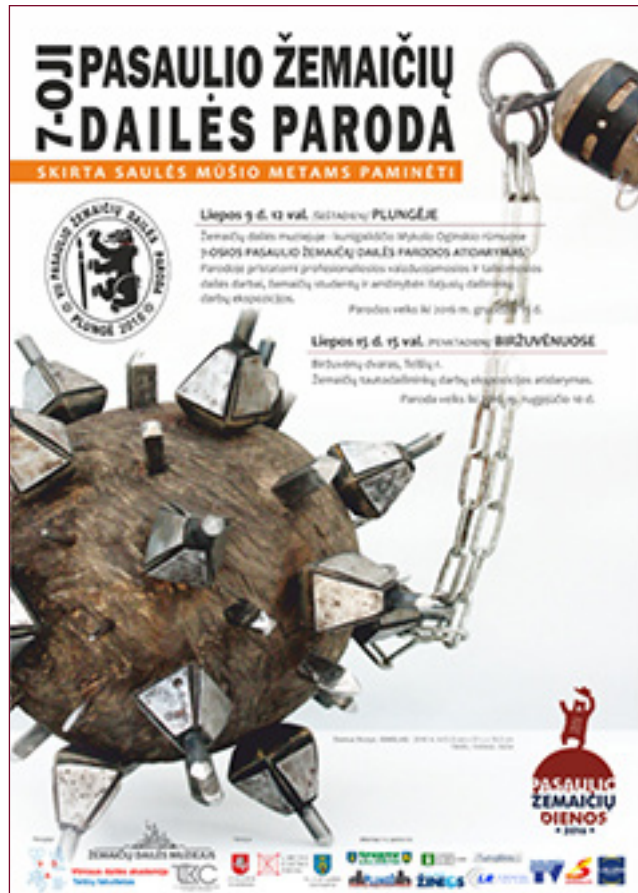
Septintosios Pasaulio žemaičių dailės parodos reklaminis plakatas