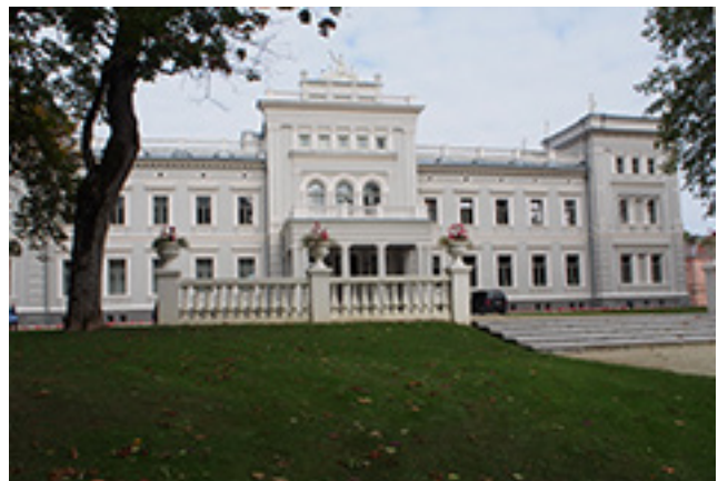
Plungės kunigaikščių Oginskių rūmai, kuriuose veikia Žemaičių dailės muziejus.

Idėja vėl pradėti organizuoti kolektyvines žemaičių dailės parodas, kuriose būtų eksponuojami žymiausių žemaičių dailininkų kūriniai, subrandin-