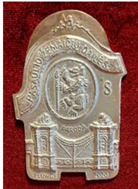
Iš kairės: septintosios ir aštuntosios Pasaulio žemaičių dailės parodų medaliai.