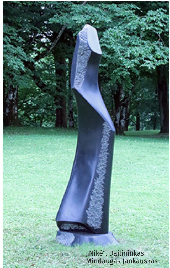
„Nikė“. Dailininkas Mindaugas Jančiauskas