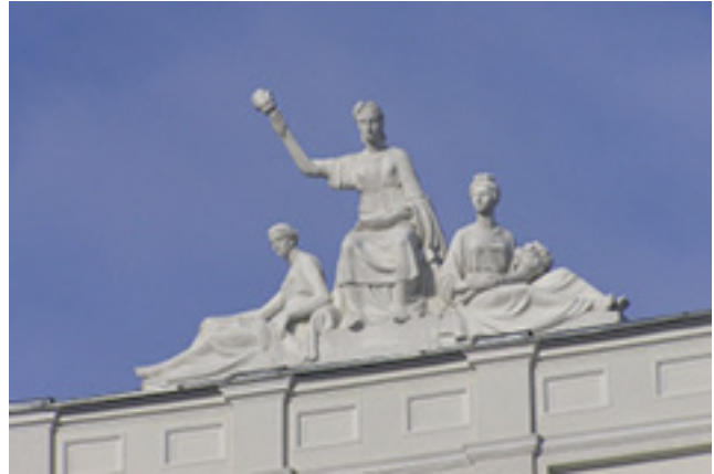
Plungės kunigaikščių Oginskių centrinių rūmų skulptūros.