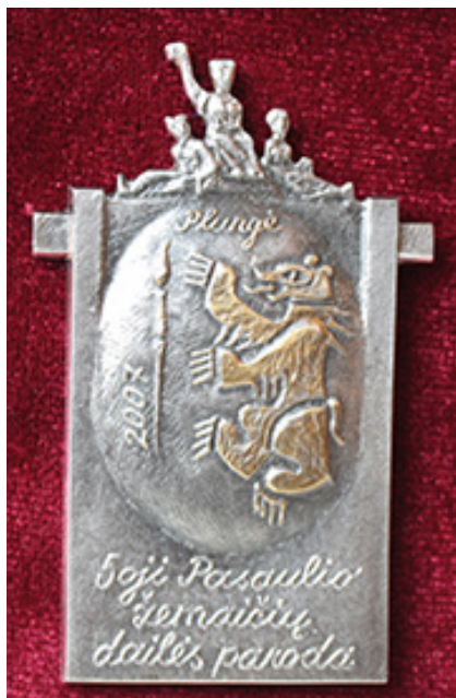
Penktosios Pasaulio žemaičių dailės parodos medalis.