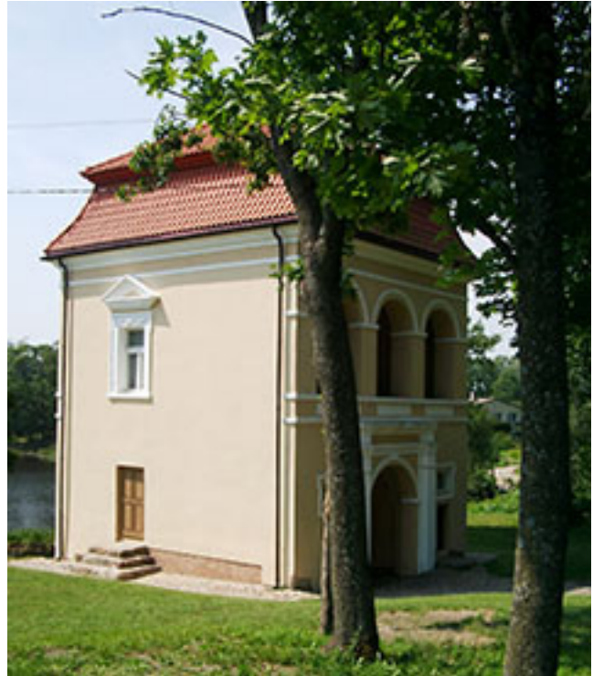
Išlikę unikalūs įvažiavimo į Kelmės dvaro sodybą vartai, kuriuose grafų Gruževskių laikais buvo biblioteka ir kalėjimas

Labiau pasisėkė toms, kuriose vėlgi, kaip ir mūrinių dvarų sodybos, buvo atiduotos švietimiečių, muziejinių žinion arba kurias ėmėsi globoti kul-