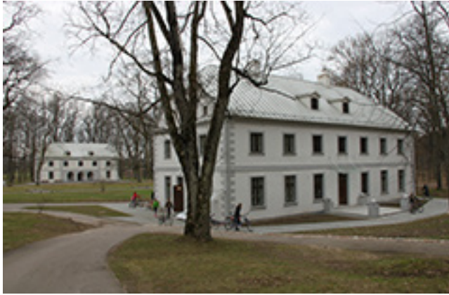
Jurbarko dvaro sodyba: atnaujintos dvaro ofcinos ir jos teritorijoje stovintis skulptoriaus Vinco Grybo muziejus.

minklas skulptoriui Vincui Grybui. Sodyboje dvaro šeimininkai buvo pasistatę iki mūsų dienų išlikusias dvi viena į kitą labai panašias, simetriškas vėlyvojo neoklasicizmo stiliaus mūrines ofcinas, vienoje iš kurių anksčiau gyveno dvaro tarnautojai, o kita buvo skirta patiems Vasilčikovams ir jų svečiams. Netoli jų ir parko vartų stovi 1865 m. pastatyta nedidelė, puošni neobizantinio stiliaus cerkvė. Lietuvai paskelbus nepriklausomybę, Jurbarko dvarvietė kartu su Vasilčikovams iki to laiko priklausiusiais dviem parkais, ten buvusiais statiniais ir vaismedžių sodu perėjo mieste veikusios „Saulės“ draugijos žinion. Sovietmečiu dvaro cerkvė buvo naudojama kaip šokių, parodų salė, kurį laiką čia net sandėliuodavo daržoves. 2002 m. po restauracijos cerkvė tapo atvira lankytojams, čia vyksta parodos. Yra renovuotos ir abi dvaro ofcinos. Pietinėje veikia Jurbarko turizmo ir verslo informacijos centras, o šiaurinėje šeimininkauja čia 1991 m. pradėjęs veikti Jurbarko krašto muziejus. Yra išlikę ir mūriniai buvę dvaro administraciniai bei keli pagalbiniai pastatai. Dalis