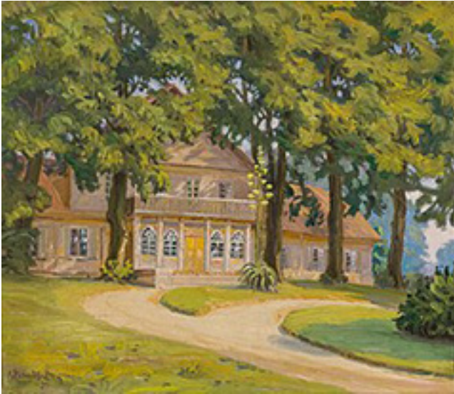
Sunykusio Šilo Pavėžulio dvaro grožį primena dailininko Antano Žmuidzinavičiaus sukurtas paveikslas, kuriame jamžinti mediniai dvaro rūmai (pastatas sudegė 1983 m. sausio 5 d. per gaisrą)