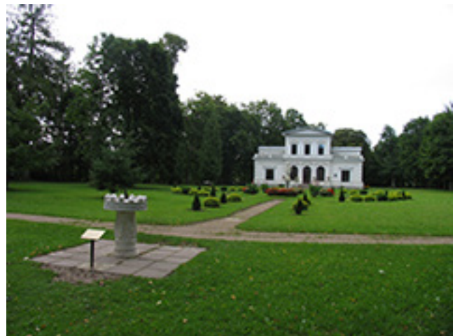
Švėkšnos Broel Pliaterių įkurto parko fragmentai, vila „Genowefa“.