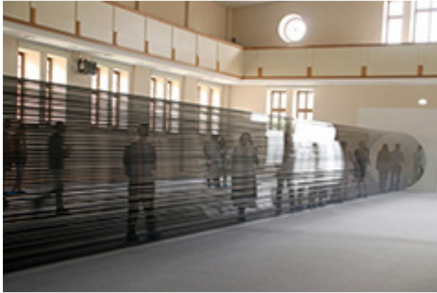
Dailininko Žilvino Kempino instaliacija „Tūba“