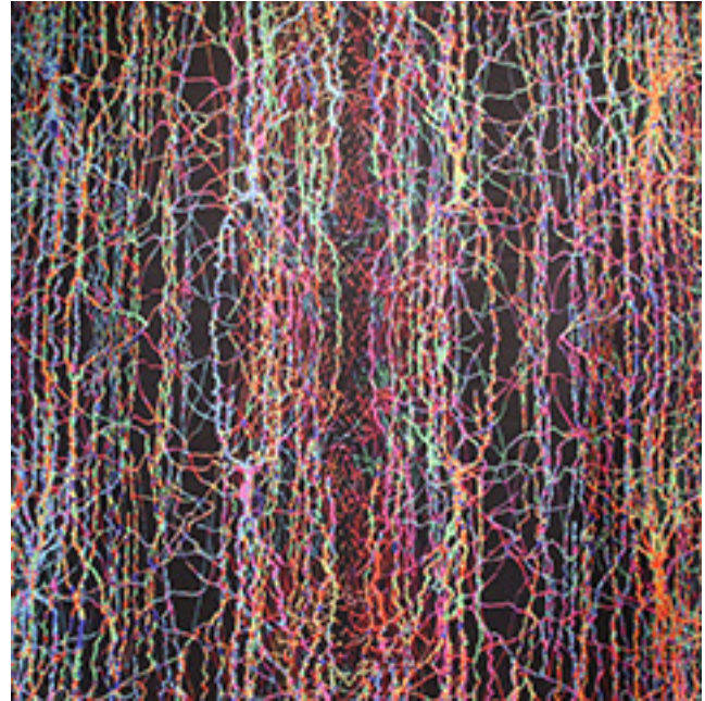
Parodoje eksponuojami spalvingi dailininko Audriaus Plioplio kūriniai