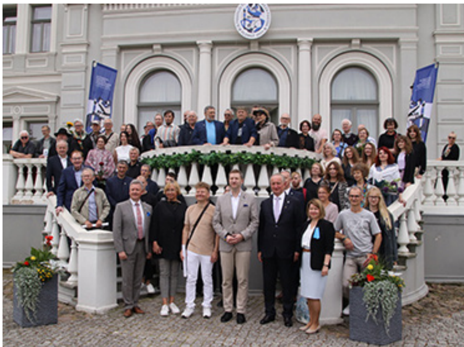
IX Pasaulio žemaičių dailės parodos atidarymo organizatorių, dalyvių ir svečių bendra nuotrauka