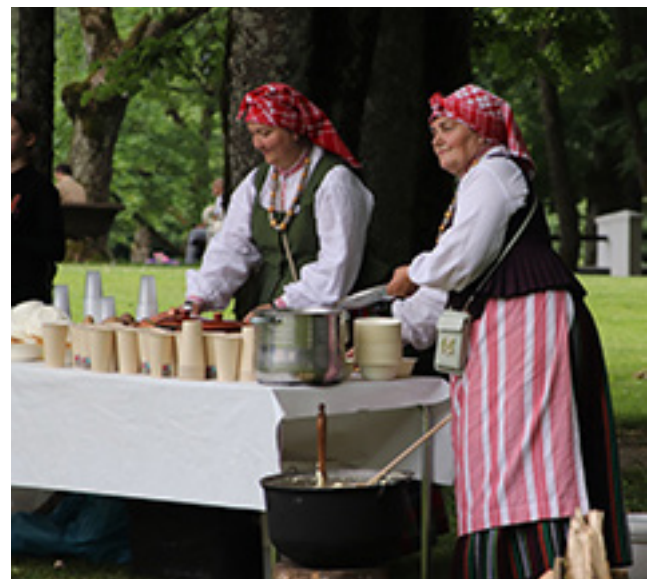
Vaišingosios Plungės žemaitės, kulinarinio paveldo puoselėtojos