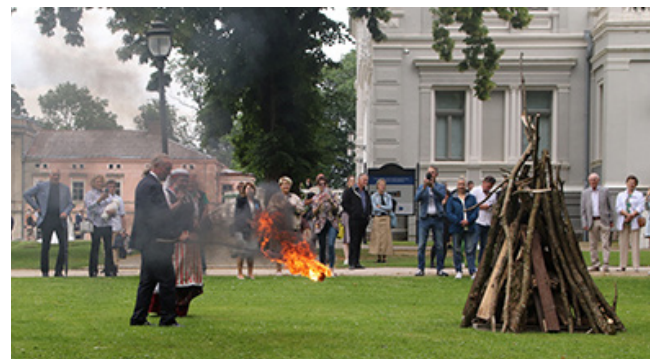
Pavakary renginio dalyviai bendravo prie laužo