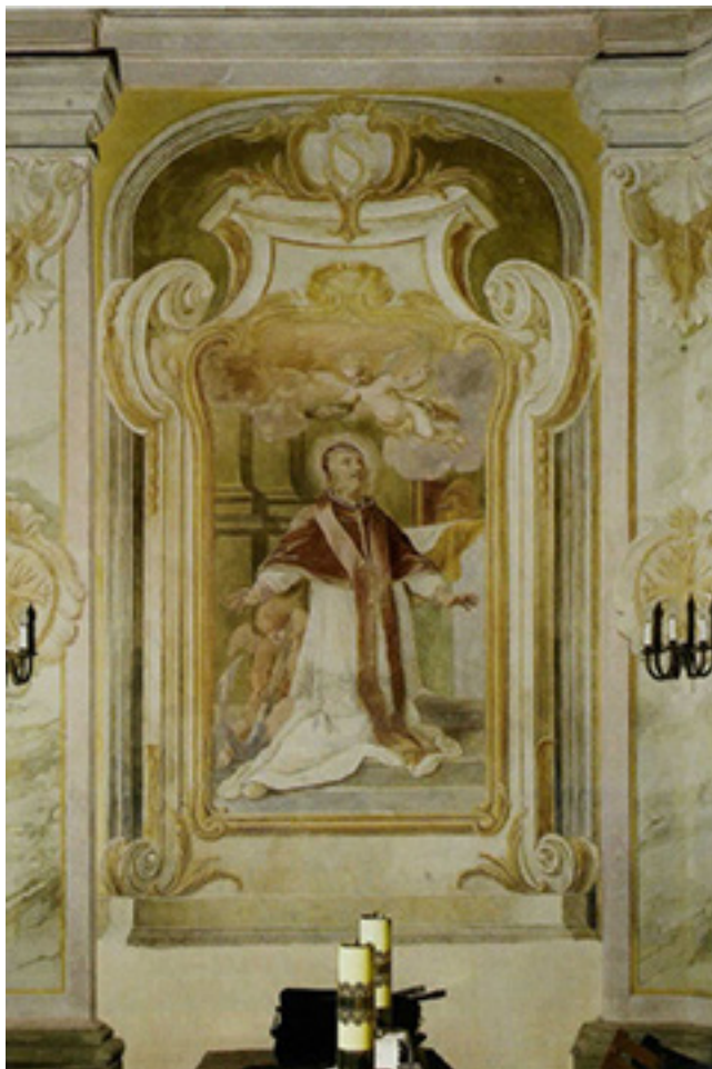
„Šv. Klemensas“ (polichromijos fragmentas). Sukurta apie 1747 metus. Dailininkas Lukošius (Lukas) Smuglevičius. Paveikslas saugomas Lenkijos Zvierzyncų šv. Jono Nepomuko bažnyčioje.

L. Smuglevičius buvo plačiai žinomas ir savo sukurtomis religinėmis, mitologinėmis kompozicijomis, skirtomis Varšuvos Augustinų bažnyčios altoriams (1761 m.), pagal Ch. Le Bruno raizinius sukurtais paveikslais „Aleksandro Makedoniečio triumfas“ ir „Aleksandras Makedonietis Darėjo palapinėje“ (abu 1775), „Darėjo mirtis“ (apie 1775), karaliaus ir jo šeimos narių portretais. Jo paveiksluose ir freskose ryškūs persipynusių vėlyvojo baroko ir rokoko, rokoko ir klasicizmo stilių bruožai.