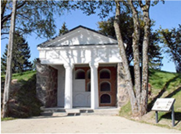
2019 m. restauruotas Sakelių šeimos mauzoliejus-kolumbariumas Pavandenėje.

vandenės dvaro savininkas. Jis gimė 1877 m. gruodžio 19 d., mirė (buvo nukankintas) 1941 m. naktį iš birželio 24 į 25 d. Rainiuose (Telšių raj.) ir, parvežus jo palaikus iš Rainių, iš pradžių buvo palaidotas Pavandenėje – jau minėtame šeimos mauzoliejuje-kolumbariume.