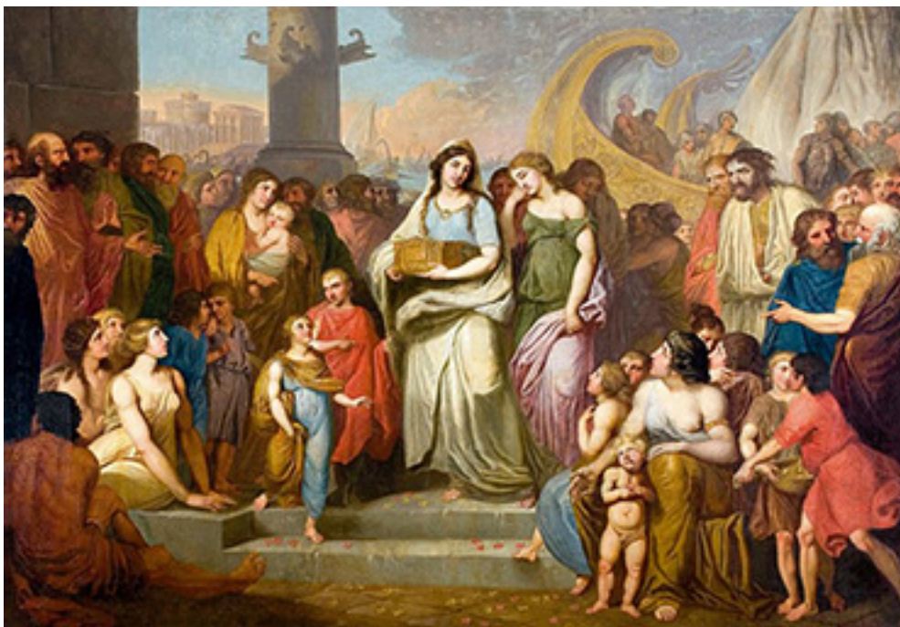
Pranciškaus Smuglevičiaus (1745–1807) 1807 m. sukurtas paveikslas „Agridina perkelia savo vyro Germonariko palaikus į tėvynę“ (drobė, aliejus, ZAM GEK 1316)