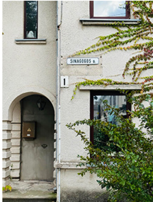
Informacinė gatvės pavadinimo lentelė prie dabartinės Sinagogos gatvės namo Nr. 1.

ją dabar informuoja ant Sinagogos g. 1 / Jūratės g. 44 namo sienos pakabinta gatvės pavadinimo lentelė bei 2023 m. sausio 27-ąją, minint Tarptautinę Holokausto aukų atminimo dieną, čia atidengta lenta, kuri žymi Palangos žydų sinagogų vietą (lenta pakabinta iš Senojo Turgaus gatvės pusės).