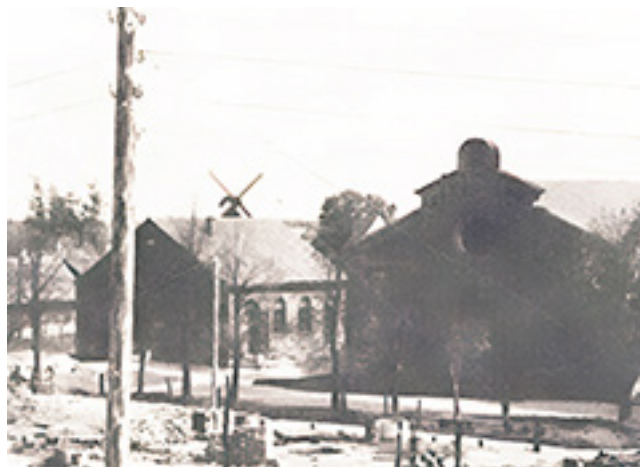
Iš kairės: Palangos Mažoji ir Didžioji sinagogos po 1938 m. gaisro.

Palangoje yra nemažai gatvių, pavadinimų iš šio miesto kilusių, Lietuvai nusipelniusių iškilių asmenybių vardais. Kai kurioms gatvėms yra suteikti ir svarbių istorinių įvykių, datų pavadinimai. Keičiantis istorijos laikotarpiams keitėsi ne tik Palangos miesto gatvių pavadinimai, bet ir jų vaizdas, todėl kiekviename kurorto gatvės pavadinime galime įskaityti ir savitą jos istoriją. Dabartiniai Palangos gatvių pavadinimai gali daug ką priminti ar papasakoti ne tik apie jose išlikusius pastatus, bet ir apie čia kadaise buvusius pastatus. Viena jų – kukli, bet Palangos žydų bendruomenei itin svarbi, religinius ir kultūrinius objektus menanti Sinagogos gatvė.