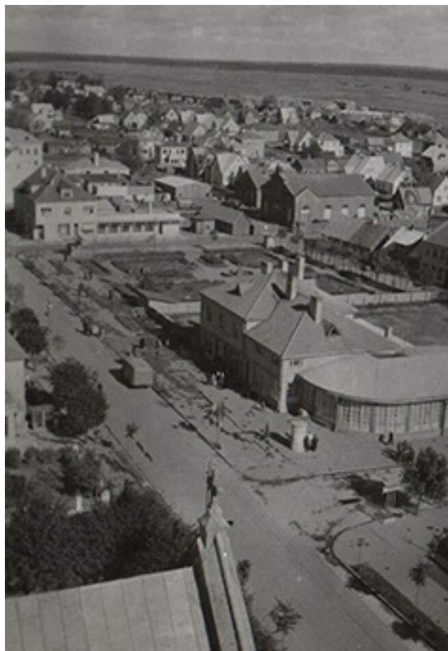
Nuotraukos antrame plane matosi Mažoji ir Didžioji sinagogos. Fotografuota 1959 m. iš Palangos bažnyčios bokšto

Didžioji dalis šioje gatvėje gyvenusių palangiškių šeimų buvo žydai. 1922 m. Palangos miesto gyventojų sąrašas – 26 palangiškiai, gyvenantys