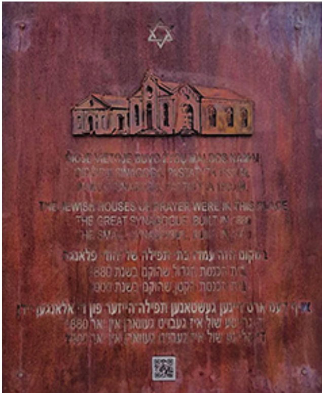
Memorialinė lenta, kuri Palangos Sinagogos gatvėje (iš Senojo Turgaus gatvės pusės) ženklina šiame kurorte buvusių Palangos žydų sinagogų vietą.