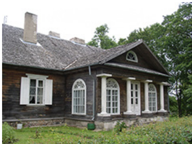
Džiuginėnų dvaro rūmų pastato fragmentas.