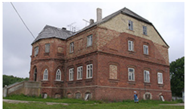
Siraičių dvaro rūmai apie 1994-uosius metus.