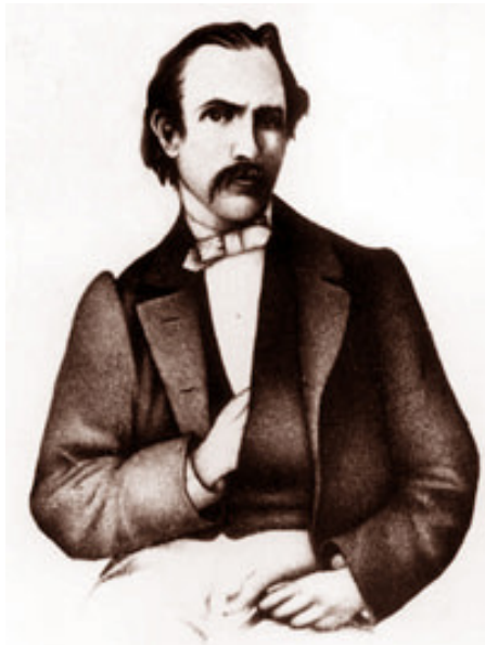
Mikalojus Akelaitis (1829–1887)