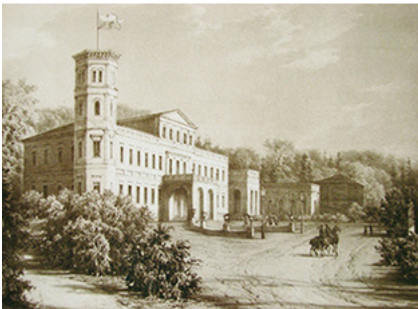
Rietavo dvaro rūmai. XIX a. Dailininkas Napoleonas Orda (1807–1883)

klą, odų gamybos įmonę, kelis malūnus ir lentpjūves.