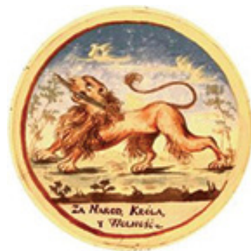
Rietavo herbas. 1792 m.

bei kitur vykusiuose simfoninės muzikos ir pučiamųjų instrumentų koncertuose. Šios mokyklos pastatas yra renovuotas. Jame nuo 2000 m. veikia Rietavo Oginskių kultūros istorijos muziejus.