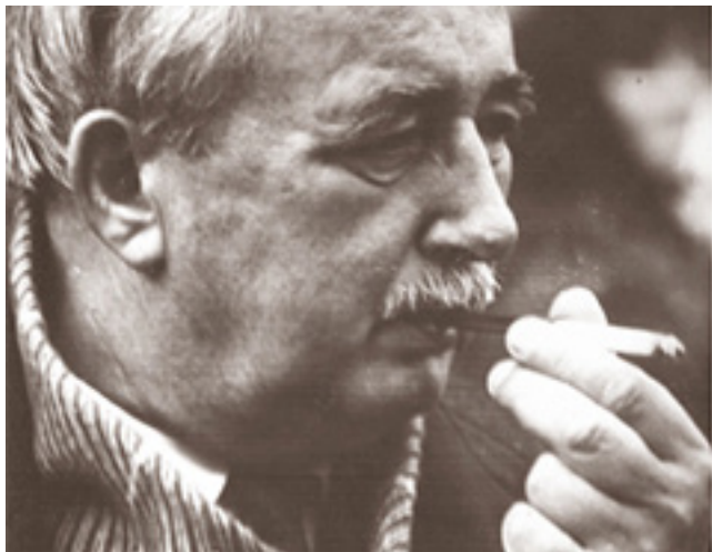
Vaclovas Chomskis (1909–1976)

Daukša ir keletas kitų ano meto šviesuolių.