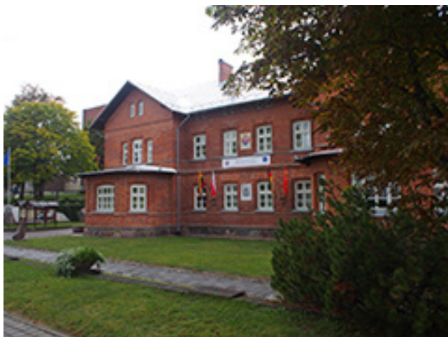
Atstatytas Rietavo kunigaikščių Oginskių įkurtos muzikos mokyklos pastatas, kuriame dabar veikia Oginskių kultūros istorijos muziejus