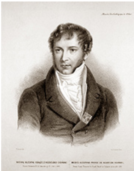
Mykolas Kleopas Oginskis (1765–1833). Dail. Fransua Grenjė (1793–1867)