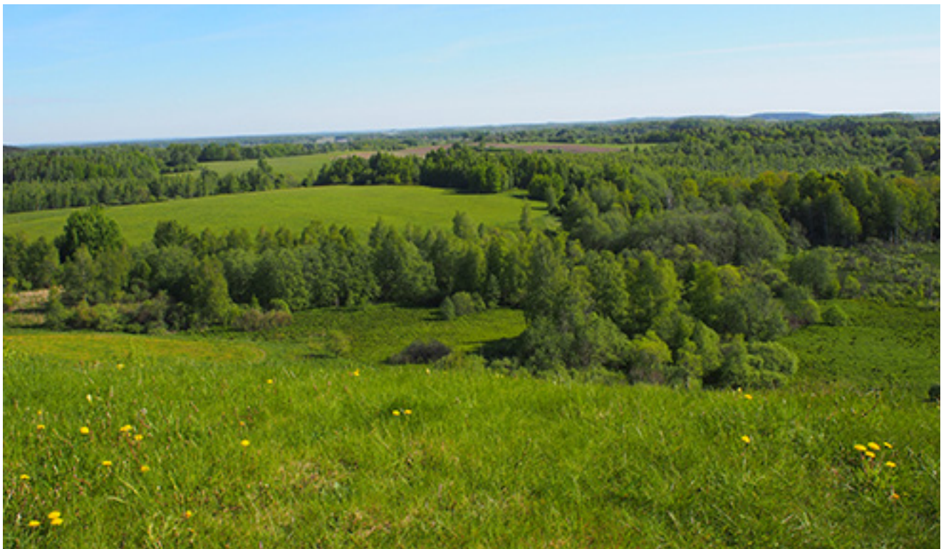
D. Mukienės portėgrapėjūo – Žemaitėjės vaizds nuo Medviegalė kalna. 2024 m. gegožės mienou

Kėta karta vedo važiou-siaiv i Bėržovienus, Loukė, dar šėn tėn pu sava rajuona, vuo paskou patrauksiau ēr platesnė. Kad pradedi keliautė, nebier ni pabonguos.