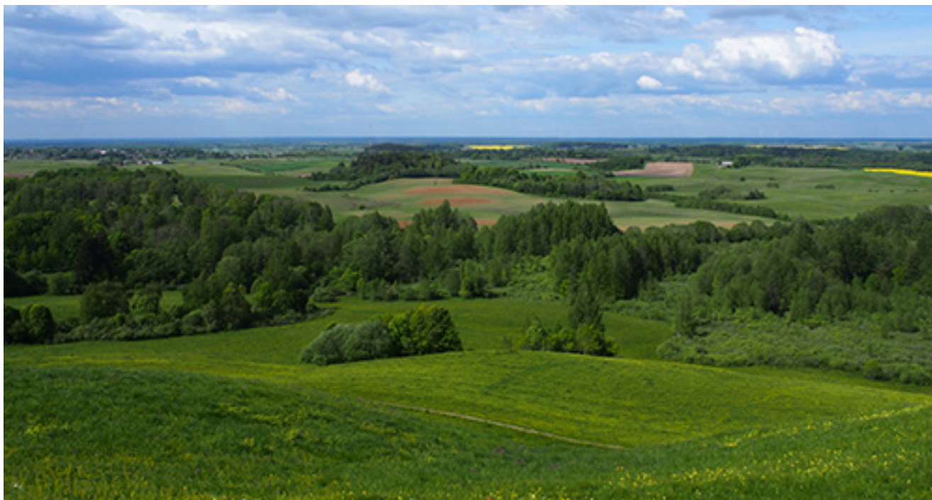
D. Mukienēs portēgrapējuo – Žemaitējēs vaizds nuo Šatrējēs kalna. 2024 m. gegožēs mienou

Anuo pusie Bliūda ežera – bovēs Sakalēnēs dvars. Ēš tuola rauduonov senē rūmā. Saka, anēi sovēsam tīžt. Kor tatā pruoets! A negalietom tokio vēituo pataisītē nakvīnēs nomū? Kad tēktā keliuoninkā soženuotom – i tuokēs vēitelēs kap virvie