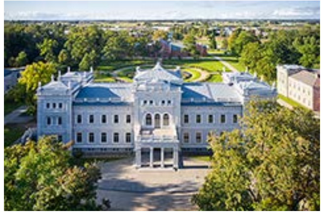
Žemaičių dailės muziejus (Plungės kunigaikščių Oginskių dvaro centriniai rūmai).