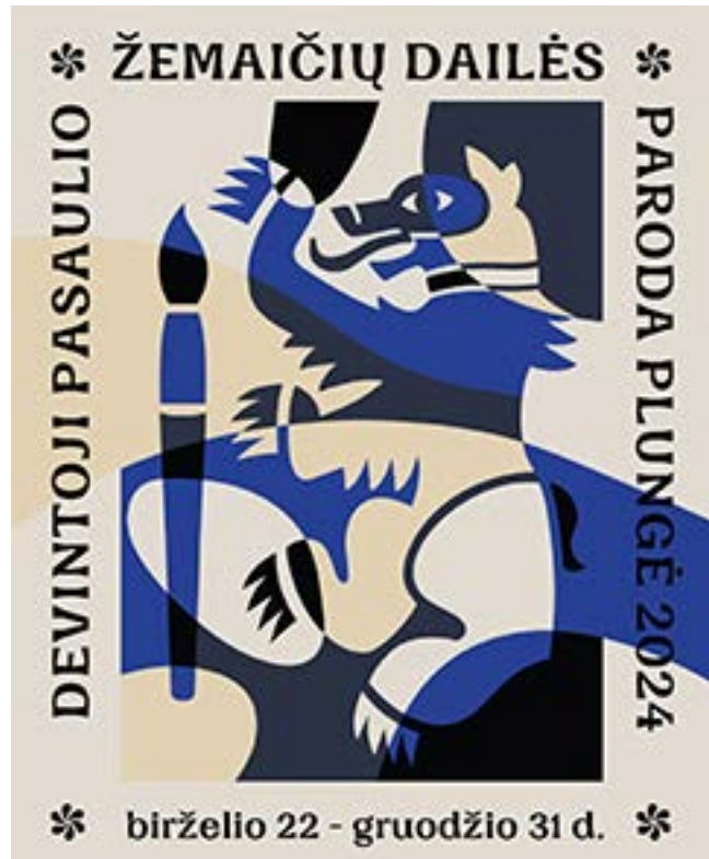
IX Pasaulio žemaičių dailės parodos plakatas