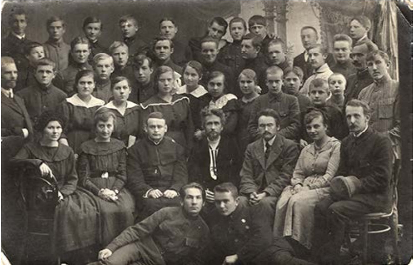
Vydūnas (sėdi centre) su Telšių gimnazijos mokiniais ir moklytojais 1920 m.

ku glūdumos ežerėlio bangos po audros. Bet kada plačiųjų jūrių, didžiųjų vandenynų gelmės įsisiūbuoja, tada nelauk greit ramybės – juo gilesnis sujudimas, juo smarkešnė audra ir ilgesnė.“