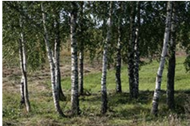
Valuckienės Virginėjės portėgrapėjė

  jė pri  pėitus. Jau vakars, vo ons neparėt. No vo, a regi, kap ir? Jau ai kė  n , ka jau pas tou pė-