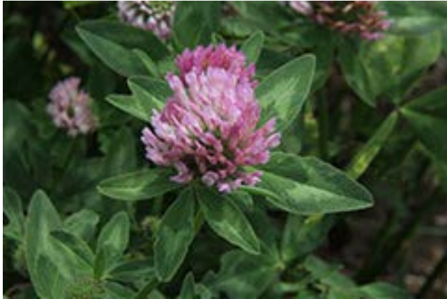
Valuckienės Virginijės portēgrapējē

No, to pavaidink tēp, ka gers esi? Jog nikomet tau kāp reikint neēšēs, vo anam ējē kap ēš natū.