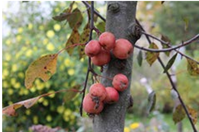
Valuckienės Virginėjės portėgrapėjė