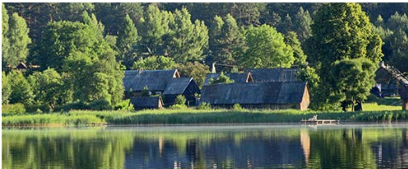
Vėngalė Bonifaca portėgrapėjė