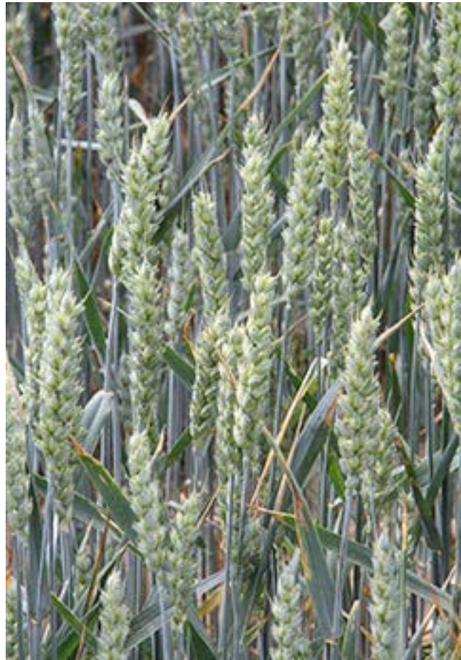
Valuckienės Virginėjės portėgrapėjė

Mon ė akis praplata. Mėslėjo: „No kuokės tuos pėršlības, kāp ėe dabā ėšėt?“ Vo Baltakis viel aiškėn: