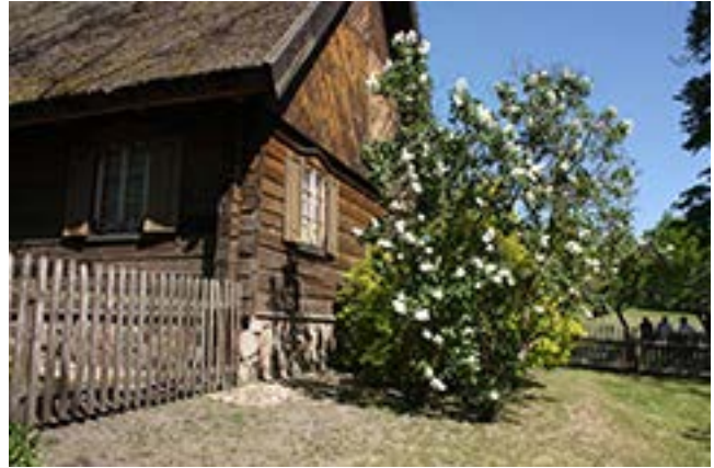
Vēngalē Bonifaca portēgrapējē

Vo tēp jau šī meta vēsks pasiotosē nodžiūva, vēsks īr mēnks, nier kuo ni tēms paukštēms doutē.