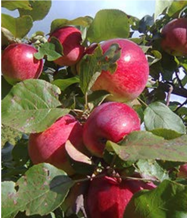
Valuckienēs Virginējēs portēgrapējē

– No, vo kou jau to pirši? Kuoki jau to če tori tou kavalerio?