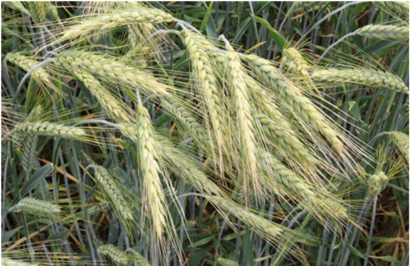
Valuckienēs Virginējēs portēgrapējē

Matā, kāp bova. Vo dabā vēsks ir aiškē, vēsks ir, kāp tam žīdou „ui, kap ont delno“. Vo a tēi televizuorē vēsuokiu neprēruoda, vēsuokiausiu?.. Baisē vaizdā vākams... Tor atētē laiks tuokēms dalīkams. Dēdlē negero laiko ruoda. Jog anēms paruoda vēskou. Ē kāp muotrēška vāka gimda paruoda. A čē ī kuoks pruots, žmuogēškoms? Čē ne žmuogēškoms, kou to mon besakītomi. Jē... Nē, dabā, veiziek, tū vākū nū nebēpakamandavousi, anēms to nieka nebēpaaiškinsi... Ui, ui, ui... Baisē prēklē tēi vākā dabā.