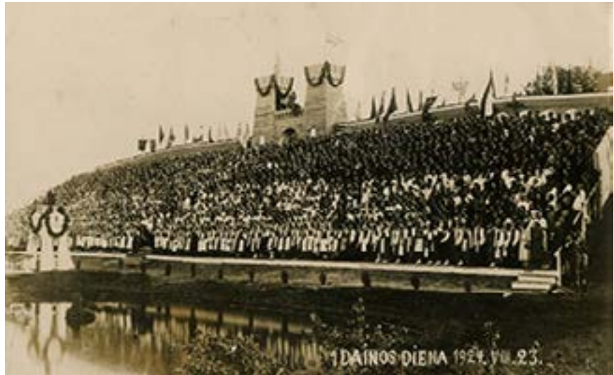
Dainuoja 1924 m. Kaune rugpjūčio 23, 25 dienomis vykusios Lietuvos dainų šventės dalyviai.

1975-aisiais liepos 18–20 dienomis vykusioje šventėje pasirodė