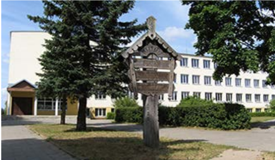
Akademinio Adolfo Jucio Plungės progimnazijos pastatas.

draugijos veikla pamažu ėmė apmirti. Plungės rajono valdžia gairinti ją nebuvo suinteresuota tad jos veikla ilgam laikui nutrūko.