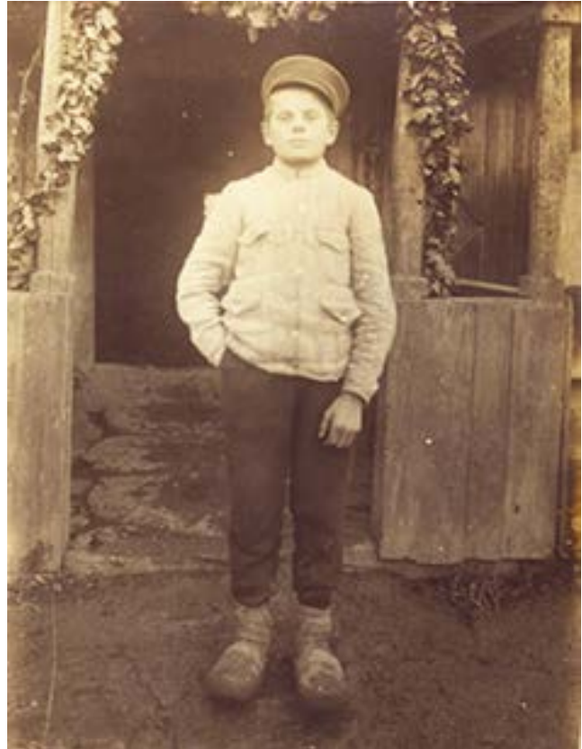
Adolfas Jucys 1919 m. Klausgalvų Mėsėdžiuose.