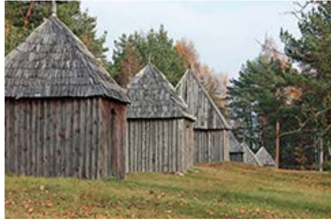
Iš kairės: Beržoro (Plungės r.) bažnyčia ir varpinė; Beržoro koplyčios.

kurios anksčiau priklausė Platelių parapijos bažnyčiai. Kapinėse mūsų jaunystės laikais dar buvo nemažai koplytstulpių, ažuolinių kryžių su įvairiomis figūromis, buvo ir akmeninių bei cementinių paminklų, vienas kitas stogastulpis. Stovėjo ir bažnytėlė, vadinama „kapinių mišauna koplyčia“. Joje buvo vargonai. Gražus ir Beržoro ežerėlis. Jo viduryje – sala. Anksčiau ežeras priklausė Platelių parapijos klebonijai. 1842 m. caro valdžia jį iš Platelių parapijos atėmė.