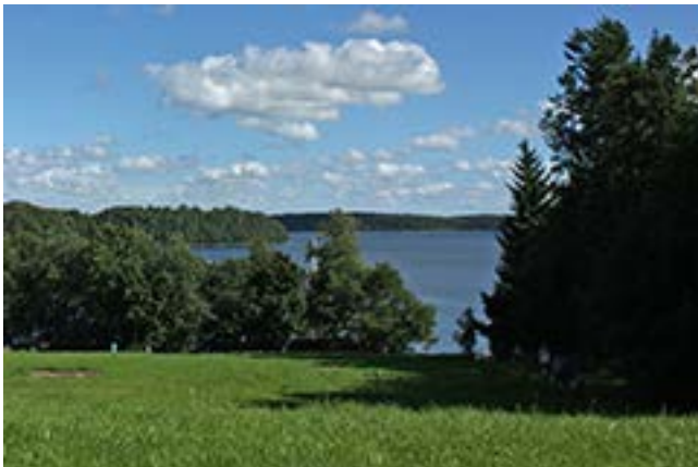
Platelių ežeras.