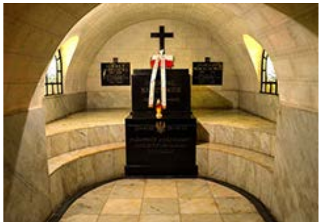
Lenkijos Respublikos prezidento Gabrieliūs Narutavičiaus (1865–1922) kapas Varšuvos Šv. Jono katedroje.