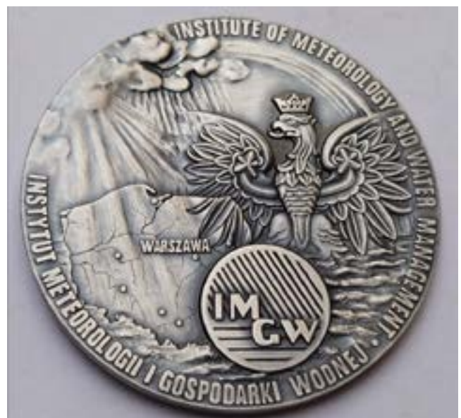
Buvusio Lenkijos Respublikos prezidento, Varšuvos Meteorologijos ir vandens vadybos instituto profesoriaus Gabrieliaus Narutavičiaus medalis. Dailininkas nežinomas.