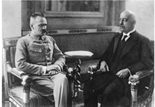
Iš kairės: Juzefas Pilsudskis ir Gabrielius Narutavičius 1922 m. gruodžio 10 d. Varšuvos Belvederio rūmuose vykusiame pasitarime.

je Juliano Ignacijaus Nowako vyriausybėje. 1922 m. spalį jis atstovavo Lenkijai konferencijoje Talyne. 1922m. rinkimuose jis rėmė centro dešinę Nacionalinę visuomeninę sąjungą ( Unia Narodowo-Państwowa ), susijusią su Juzefu Pilsudskiu. Gabrielius tada buvo Rytų pasienio visuomenės sąjungos ( Państwowe Zjednoczenie na Kresach ) kandidatas, bet negavo vietos parlamente. Pralaimėjęs rinkimus į parlamentą, jis toliau dirbo užsienio reikalų ministru Juliano Nowako vyriausybėje.