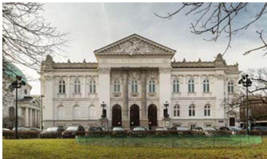
Nacionalinės dailės galerijos Zachęta pastatas, kuriame 1922 m. gruodžio 16 d. buvo nužudytas Lenkijos Respublikos prezidentas Gabrielius Narutavičius.

289 balsus, o M. Zamoyskis – 227 balsus. Taip G. Narutavičius tapo pirmuoju Lenkijos Respublikos prezidentu šaliai atgavus savarankiškumą.