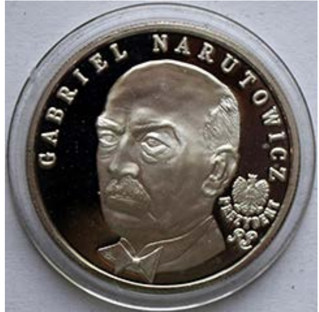
Paausutas Gabrieliaus Narutavičiaus medalis. Dailininkas nežinomas.