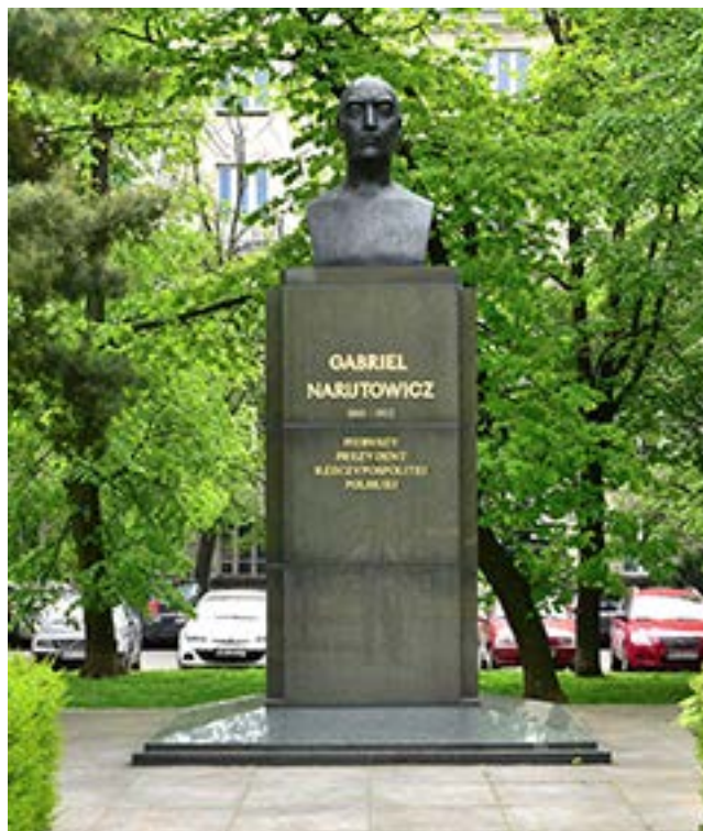
2002 m. gruozio 9 d. Varšuvoje atidengtas paminklas Lenkijos prezidentui Gabrieliui Narutavičiui. Paminklas sukurtas pagal Edvardo Wittingo kūrinį, esantį Varšuvos technologijos universiteto auditorijoje.