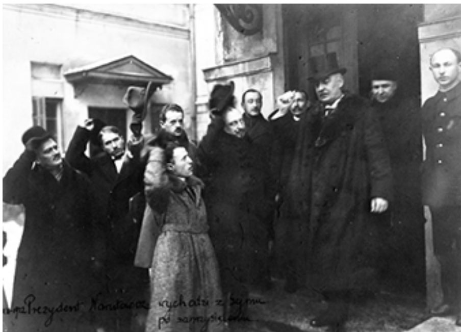
Lenkijos Respublikos prezidentas Gabrielius Narutavičius palieka Seimą po priesaikos. Varšuva, 1922 m. gruodžio 11 diena.

1922 m. gruodžio 9 d. Lenkijoje vyko pirmieji prezidento rinkimai. Varžėsi penki kandidatai: Maurycijus Klemsas Zamoyskis, Stanislawas Wojciechowski, Gabrielius Narutavičius, Ignacijus Daszynskis ir Janas Baudouin de Courtenay. Tada Lenkijoje veikė kairiosios, dešinėsios, centro ir mažumos partijos. Norint laimėti rinkimus reikėjo turėti kelių partijų paramą. Po pirmojo balsavimo turo aiškaus nugalėtojo nebuvo. Jo metu G. Narutavičius surinko 62 balsus, o M. Zamoyskis – 222. Antrajame ture mažiausiai balsų surinkęs oficialus socialistų kandidatas I. Daszynskis iš rinkimų buvo pašalintas, bet ir tada aiškaus nugalėtojo dar nebuvo. Vėlesniuose turuose iškrito dar du kandidatai – J. Baudouin de Courtenay ir Stanislawas Wojciechowski, kuriuos rėmė tautinių mažumų atstovai (pastarąjį palaikė ir dalis kairiųjų). Po ketvirtojo turo lemiamame ture varžėsi grafas M. Zamoyskis (jį palaikė dešinieji) ir G. Narutavičius (jį rėmė kairieji ir mažumos). Lenkijos liaudies partija „Piast“, kuri buvo centro partija ir iš pradžių rėmė S. Wojciechowskį, dabar turėjo nulemti, kas taps prezidentu. Ši partija palaikė valstiečius, kurie atsisuko prieš žemvaldžių šalininką M. Zamoyskį, todėl neleido laimėti rinkimų M. Zamoyskiui. Šiame rinkimų ture G. Narutavičius gavo