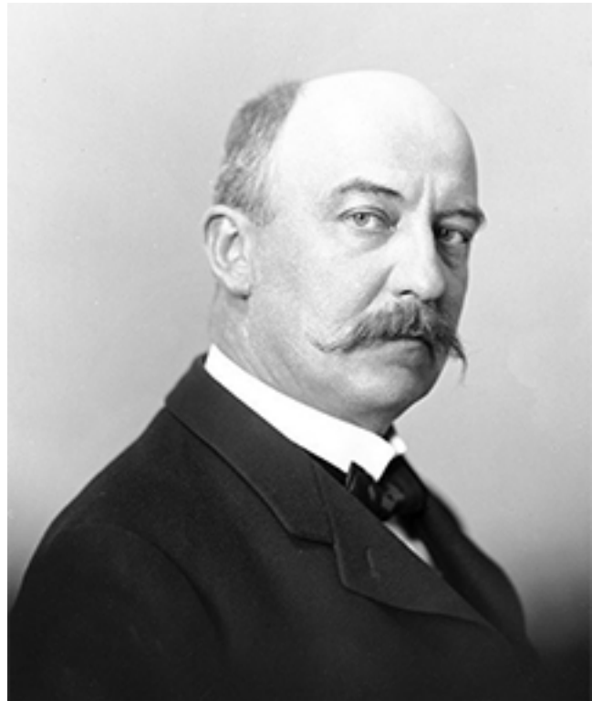
Gabrieliūs Narutavičius 1915 m. Šveicarijoje.

G. Narutavičiaus nužudymas yra pagrindinė 1977 m. sukurto lenkų vaidybinio filmo „Prezidento mirtis“ (lenk. Śmierć prezydenta ), kurį režisavo Jerżis Kawalerowiczus, tema. Šis prezidentas Lenkijoje su pagarba minimas iki šiol. Čia puoselėjamas ir jo atminimas.