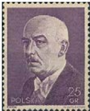
Lenkijos Respublikoje išleisti pašto ženklai su Gabrieliaus Narutavičiaus atvaizdais