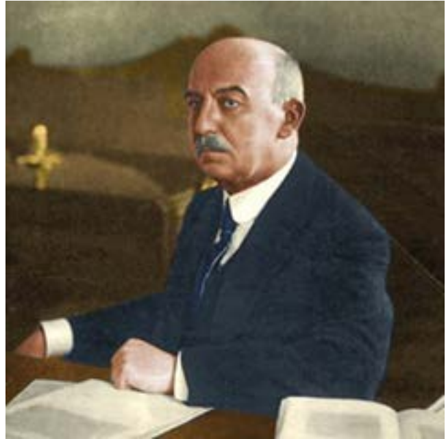
Lenkijos Respublikos prezidentas Gabrielius Narutavičius 1922 m.