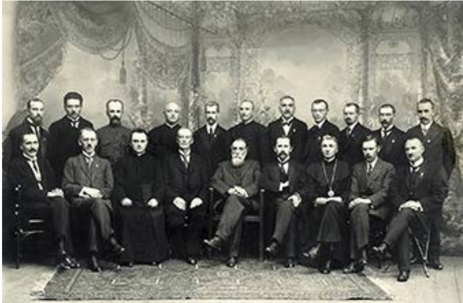
Lietuvos Taryba, 1918 m. vasario 16 d. pasirašiusi Nutarimą dėl nepriklausomos Lietuvos valstybės atkūrimo (Lietuvos Nepriklausomybės Aktas). Iš kairės sėdi: Jonas Vileišis, Jurgis Šaulys, Justinas Staugaitis, Stanislovas Narutavičius, Jonas Basanavičius, Antanas Smetona, Kazimieras Šaulys, Steponas Kairys, Jonas Smilgevičius; iš kairės stovi: Kazimieras Bizauskas, Jonas Vailokaitis, Donatas Malinauskas, Vladas Mironas, Mykolas Biržiška, Alfonsas Petrulis, Saliamonas Banaitis, Petras Klimas, Aleksandras Stulginskis, Jokūbas Šernas, Pranas Dovydaitis. Vilnius, 1917 m. rugsėjo 25 d.