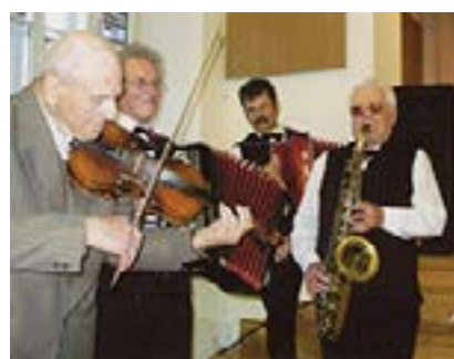
Viršuje – 2013.09.17 VŽKD vakaronėje groję muzikantai; dešinėje – draugijos kultūros vakaro „Mūsų protėvių šnektą“ organizatoriai ir svečiai. 2013.05.21