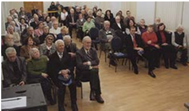
Nuotraukose: viršuje – 2014 m. sausio 21 d. vykusio VŽKD ataskaitinio-rinkiminio susirinkimo dalyviai, dešinėje – susirinkimo metu išrinkta nauja VŽKD taryba