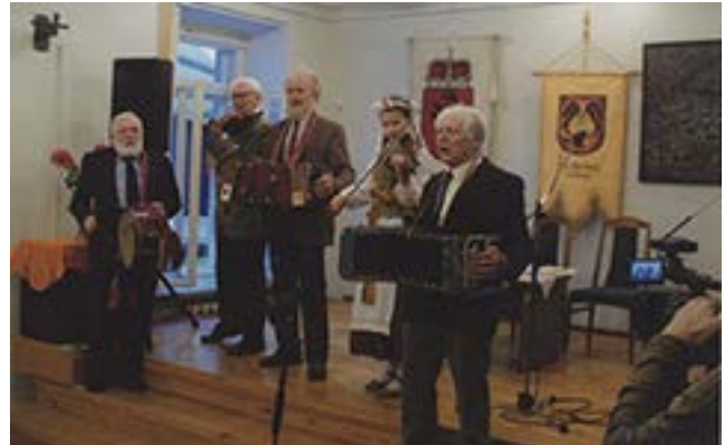
Nuotraukose (iš kairės): 2014 m. spalio 21 d. vukusio VŽKD kultūros vakaro dalyviai; groja VŽKD muzikantai. 2014.09.16