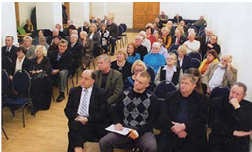
2013 m. sausio 16 d. vykusio VŽKD ataskaitinio susirinkimo dalyviai (bendras salės vaizdas)

SAUSIO 18 d. būrys VŽKD narių dalyvavo Vilniaus karininkų ramovėje vykusiame Vilniaus rokiškėnų klubo „Pragiedruliai“, su kuriuo draugija jau daug metų palaiko glaudžius ryšius, veiklos