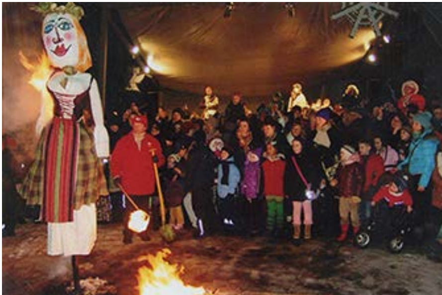
2013 m. vasario 12-ąją Vilniaus mokytojų namų kiemelyje vykusių Užgavėnių šventės akimirka