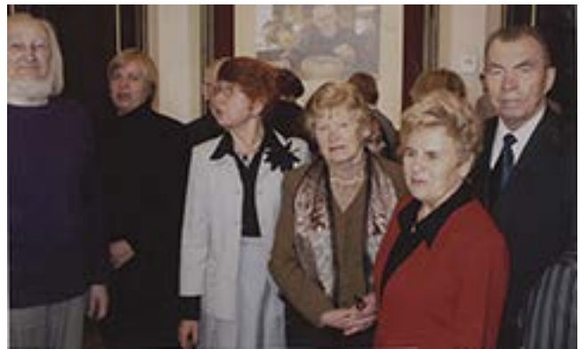
Draugijos nariai Lietuvos dailės muziejaus Vilniaus paveikslų galerijoje veikusioje Marcelijaus Martinaičio margučių parodoje. 2014.04.17