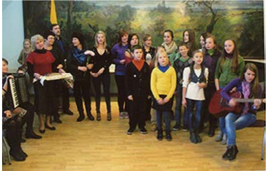
2013 m. spalio 18 d. Vilniaus karininkų ramovėje vykusio Ylakių vidurinės mokyklos (Skuodo r.) moksleivių parodos atidarymo akimirka