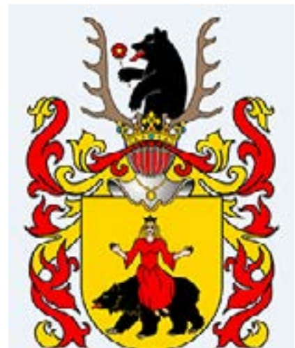
Kunigaikščių Solomereckių personalinis Ravičo herbas