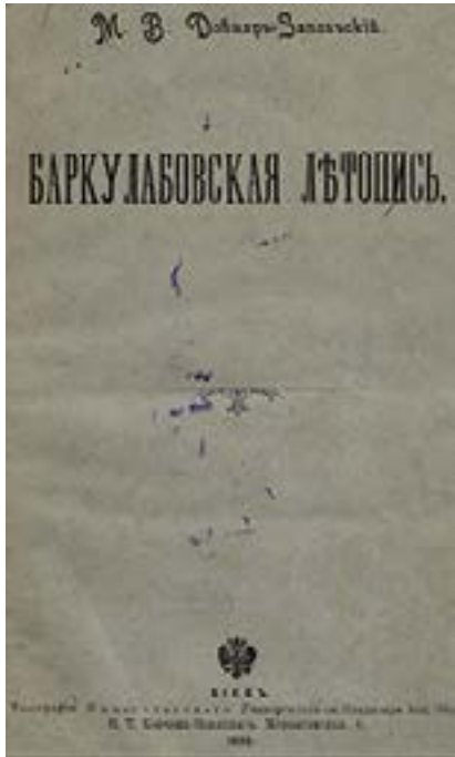
Baltarusių-lietuvių istorinio šaltinio „Barkulabovo metraštis“ 1908 m. leidimas

tas Augustas jį paskyrė pirmuoju naujai įsteigtos Mstislavlio vaivadijos kaštelionu. Dabar Mstislavlis – rajoninės reikšmės miestas Baltarusijos Mogiliavo srityje prie sienos su Rusijos Federacija. Nuo XII a. žinoma Mstislavlio kunigaikštystė. Ją Lietuvos didysis kunigaikštis Algirdas buvo prijungęs prie LDK.