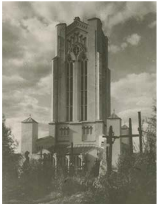
Šiluvos Švč. Mergelės Marijos Apsireiškimo koplyčia 1922 metais.