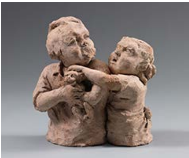
Antano Vivulskio skulptūrėlė „Vaikai su šuniuku“. XX a. 1–2 deš. LNDM S 800.