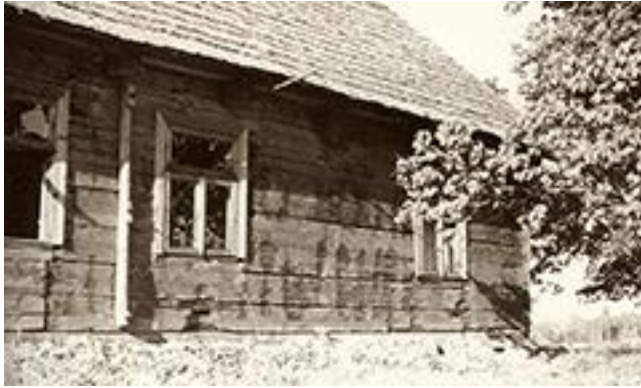
Mačernių gyvenamojo namo Šarnelėje fragmentas. Dešinėje – kambario, kuriame gyvendavo poetas V. Mačernis, langai.