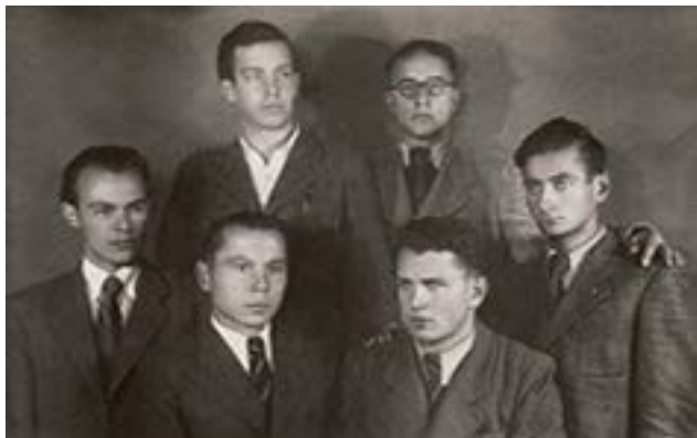
Šatrijėčiai draugai. Pirmoje eilėje iš dešinės: V. Mačernis, M. Indriliūnas, K. Bradūnas, P. Jurkus; antroje eilėje: B. Krivickas, E. Matuzevičius.

Šarnelėje Mačernių ūkis buvo didelis. Vytautas ne itin mėgo žemės ūkio darbus, bet, atvykus į svečius draugams, su jais ne tik poilsiaudavo, dalindavosi naujienomis, diskutuodavo, bet ir padėdavo ūkyje. Čia jo draugai gaudavo ne tik nakvynę, bet būdavo ir pamaitinami. Atskirai jiems niekas maisto neruošdavo – ką valgė kiti šeimos nariai, tas būdavo patiekiamas ir Vytautui bei jo draugams.