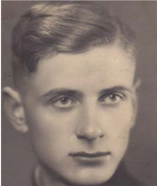
Vytautas Mačernis (1921–1944).