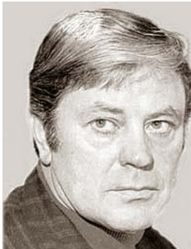
Donatas Banionis (1924–2014).

Istorija, kurią pateikiame šioje publikacijoje,