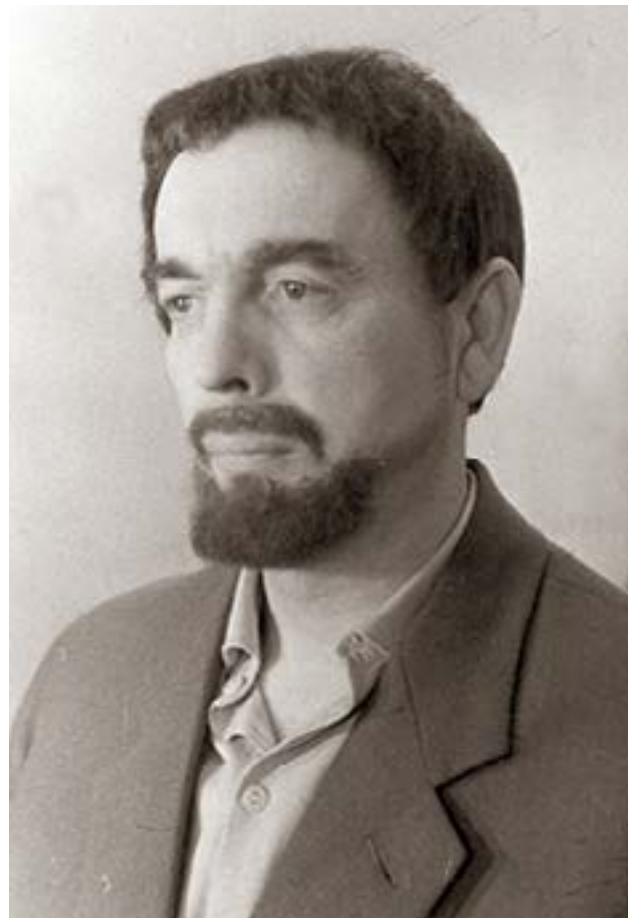
Aktorius ir režisierius Juozas Miltinis (1907–1994) savo kūrybinio kelio pradžioje.

Paskui man teko gyventi pas gimines Šašaičių kaime, netoli Varduvos miestelio. Tada man buvo 14–15 metų. Pas mano giminaičius rinkdavosi tuo metu Varduvos apylinkėse gyvenę intelektua-