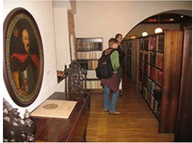
Viršuje ir kairėje – Kazio Varnelio surinktų knygų bibliotekos, Kazio Varnelio namuose-muziejuje, fragmentai. 2009 m. D. Mukienės nuotraukos