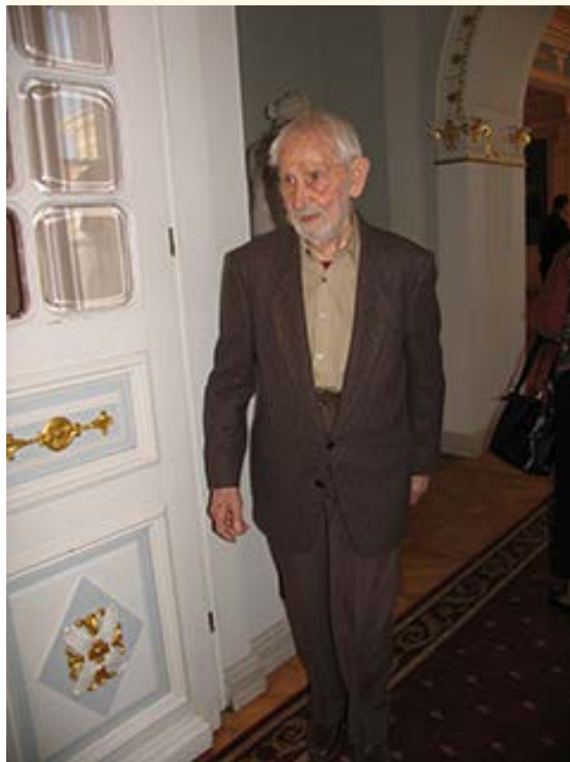
Kazys Varnelis apie 2006-uosius metus.