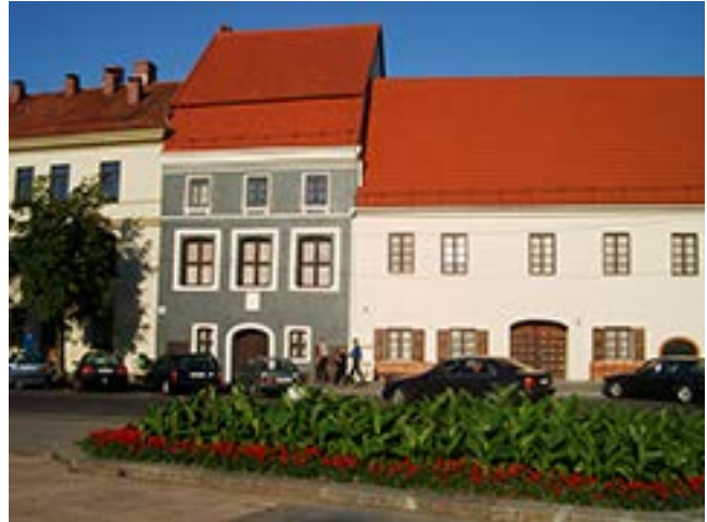
Vilniaus Didžiosios gatvės fragmentas. Dešinėje – pastatas, kuriame veikia Kazio Varnelio namai-muziejus.

Masalskių / Pirklių namas, kurio šeimininkai yra buvę Masalskiai, Tšėčiakai, Davidovičiai, Domanskiai, pastatytas XVI–XVII amžių sandūroje. Ilgą laiką jo antrasis aukštas buvo pritaikytas gy-