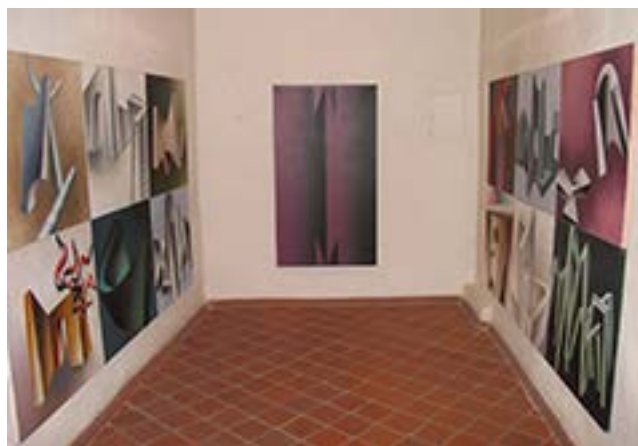
Kazio Varnelio kūriniai K. Varnelio namuose-muziejuje. 2009 m.