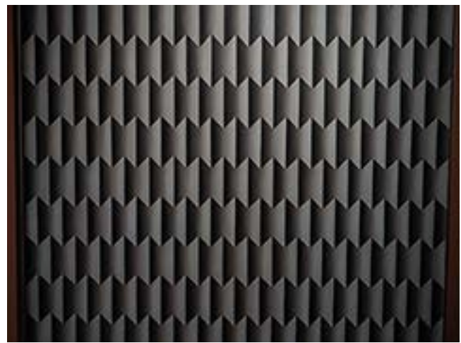
Parodos „Tapatybė ir forma. Kazio Varnelio kūryba Jono Šliūpo muziejuje“ fragmentai ir eksponatai.