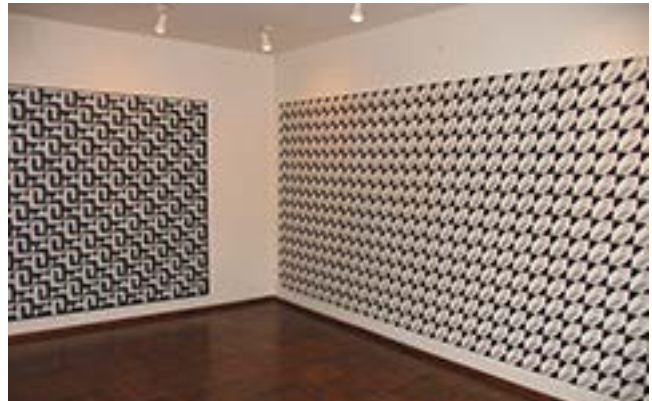
Kazio Varnelio kūriniai K. Varnelio namuose-muziejuje. 2009 m. 2009 m.

kų bažnyčioms sukūrė nemažai vitražų, altorių, Kryžiaus kelio stočių, kitų interjero detalių. Netruko jis įsijungti ir į Čikagos lietuvių kultūrinį gyvenimą, tapo čia kūrusių dailininkų bendruomenės nariu.