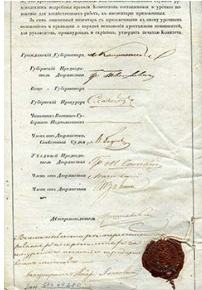
Iš kairės: senosios Įpilties, Benaičių, Žynelių, Kalgraužių kaimų 1845 m. inventorinio aprašo titulinis puslapis; Kartenos dvaro 1845 m. inventorinio aprašo paskutinytis puslapis

jamos žemės kiekis, nuomos laikotarpis ir kaina, sąlygos nuomininkui. Sutartys patvirtintos žemės savininkų arba jų patikėtinių bei nuomininkų parašais. Jei šie būdavo neraštingi, už juos pasirašydavo raštingi liudininkai, dažniausiai bajorai. Kai kurios sutartys patvirtintos Kartenos valsčiaus valdybos antspaudu ir valsčiaus viršaičio parašu.