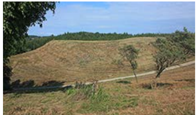
Kartenos piliakalnio fragmentai.