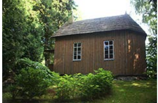
Kartenos lurdas ir koplytėlė prie jo.

džiavą – bylinėjimusi su laisvaisiais žmonėmis.