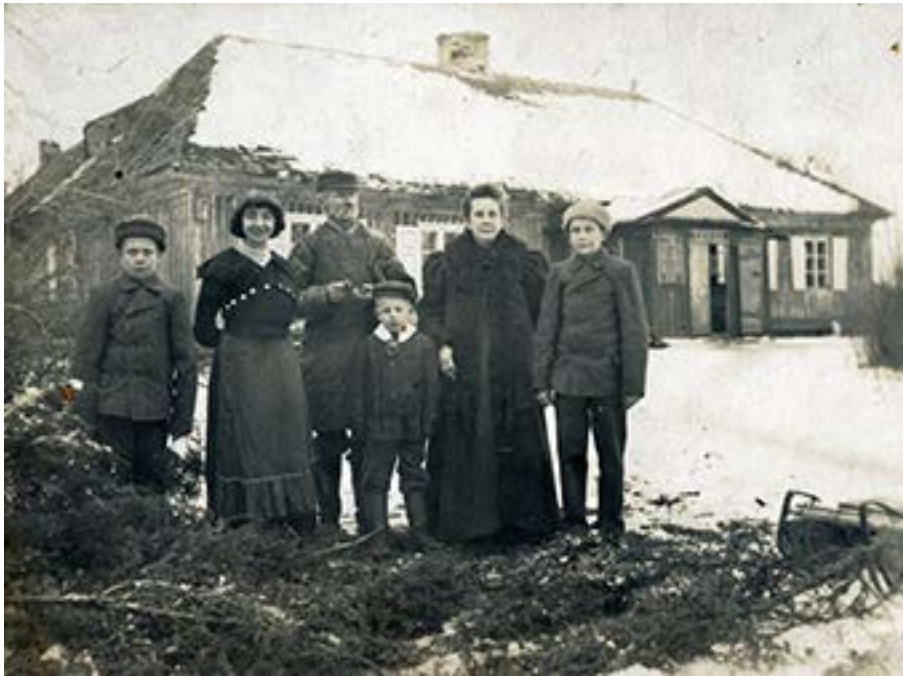
Kartenos dvaro tarnautojų Stoškų šeima šalia Kartenos dvaro medinių rūmų 1920 metais.

miteto rudo lako antspaudas (vietomis nutrupėjęs).