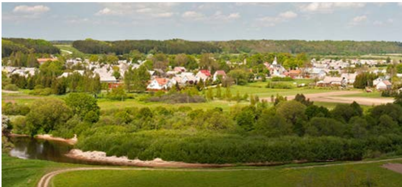
Kartenos miestelio panorama (vaizdas iš Kartenos piliakalnio pusės).