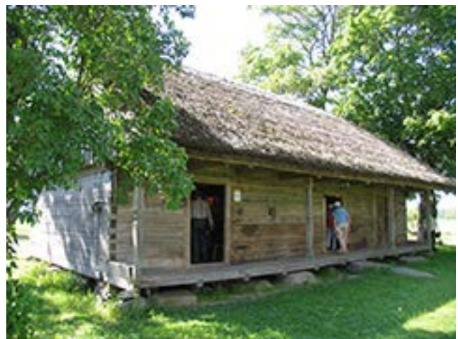
Klėtelė Simono Daukanto gimtojoje sodyboje Kalvių kaime (Skuodo raj.). Joje įrengta ekspozicija pasakoja apie du šio krašto mokslo vyrus – Simoną Daukantą ir Jurgį Pabrėžą.

viškojo sąjūdžio, kuris siekė padėti kultūrinius pamatus moderniai lietuvių tautai, dalyvis. Šiam sąjūdžiui priklausė ir jo bičiuliai Liudvikas Adomas Jucevičius, Dionizas Poška, Kajetonas Nezabitauskis, Jurgis Pliateris, Simonas Stanevičius, keletas kitų žemaičių. S. Daukantas palaikė glaudžius ryšius ir su savo žemiečiu botaniku, taip pat dideliu lietuvių kalbos puoselėtoju, botaniku, kunigu, pranciškonų vienuoliu, pamokslininku, vienu iš žemaičių rašybos pradininkų Jurgiu Pabrėža. Jis bendradarbiavo ir su istoriku Teodoru Narbutu, daugeliu kitų