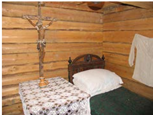
Ekspozicijos S. Daukanto klėtelėje (Kalvių k., Skuodo raj.) fragmentai.

iškilių Lietuvos mokslo, kultūros veikėjų.