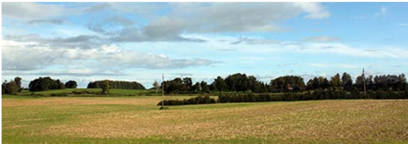
Kalvių apylinkėse kiek akys užmato – lygumos