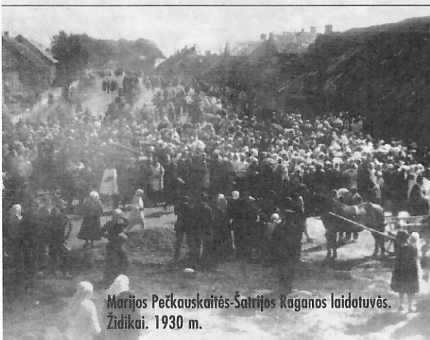
Marijos Pečkauskaitės-Šatrijos Raganos laidotuvės. Židikai. 1930 m.

Gamta iš tiesų yra tai, kas mumyse pažadina tai, kas jau nėra gamta. Gamta prakalbina mumyse tai, ko mes dažnai nežinome turintys savyje. Šatrijos Ragana buvo ne tik reginti, bet ir girdinti šį pasaulį, jo žydėjimą, ypač – rudenį, tą nuotaiką, kai viskas nyksta, miršta, kai iš tiesų visas pa-