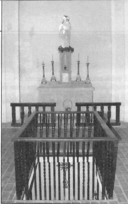
Marijos Pečkauskaitės-Šatrijos Raganos koplyčioje