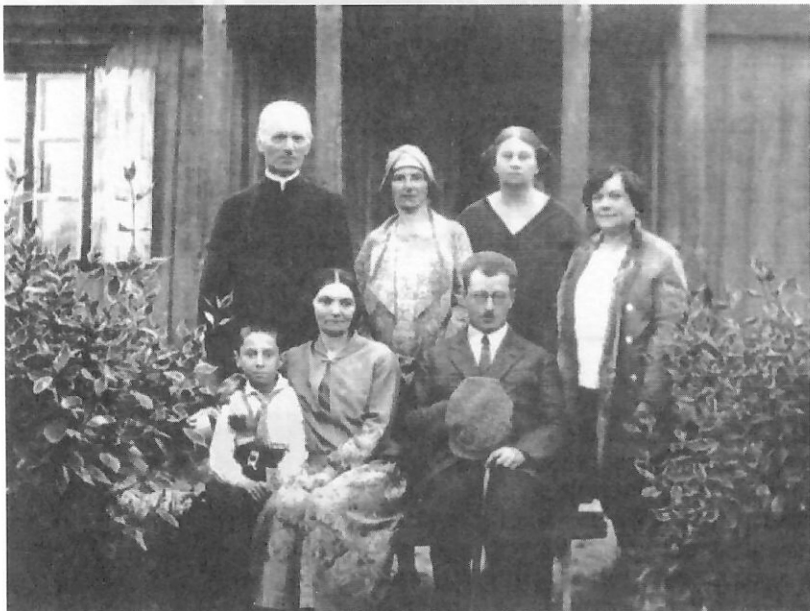
(Atkelta iš 57 psl.)

savo kambarėlyje. 1918 m. Židikuose atidarius legalią lietuvišką pradinę mokyklą, apylinkėje siautė neramumai, daug kas gyveno revoliucinėmis nuotaikomis, kurioms Marija nepitarė, todėl rašytoja atsisakė toje mokykloje dirbti, nors vėliau ir konsultuodavo mokyklos vadovą ir mokytojus pedagogikos klausimais, organizuodavo vaikams Kalėdų eglutes, šelpdavo priešpiečiais neturtingus mokinius.