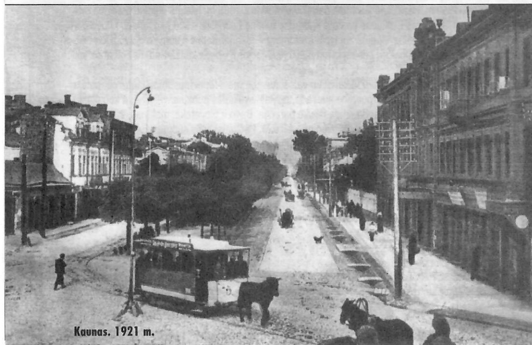
Kaunas. 1921 m.