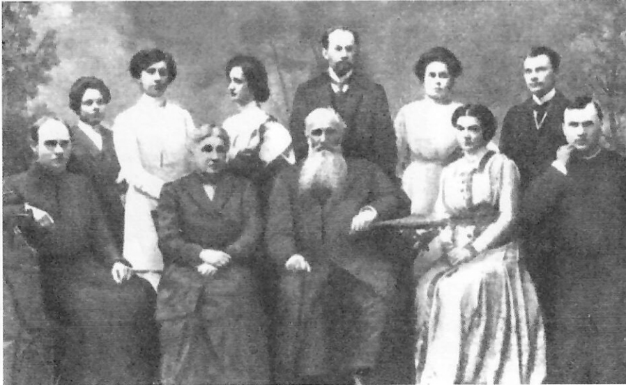
Marija Pečkauskaitė (sėdi antra iš dešinės) su „Žiburio“ progimnazijos mokytojais Marijampolėje

si privačiai mokyti dvarų savininkų vaikus. Taigi, mąstydamą apie pragyvenimą, ji renkas pedagogikos sritį. Kur mokytojavo, sužinome iš pačios Marijos laiško (autobiografijos) T. Vaižgantui: „1899 buvau pas motiną Šiauliuose, 1900 pas Laucevičius Mūruose, 1901-1904 Pavandenyje“. Tuometinė padėtis Marijai buvo ne itin priimtina. Minėtuose dvaruose ir pats mokytojos darbas Marijai buvo nelengvas. Ten atmosfera buvo sunki, todėl dienos buvo panašios viena į kitą, kaip vandens lašai, Marija dažnai jausdavosi labai suvaržyta, todėl ją dažnokai apimdavo depresi-