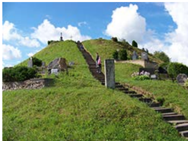
Simono Daukanto memorialinis muziejus Papilėje ir Papilės piliakalnis, kurio viršuje esančiose kapinėse yra S. Daukanto amžinojo poilsio vieta.