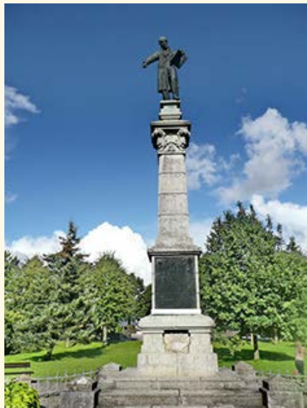
Iš kairės: Simono Daukanto veikalo „Darbai senųjų lietuvių ir žemaičių“ vieno puslapio rankraštis; S. Daukanto paminklas Papilėje (Akmenės raj.). 1928–1930. Skulptorius Vincas Grybas (1890–1941).