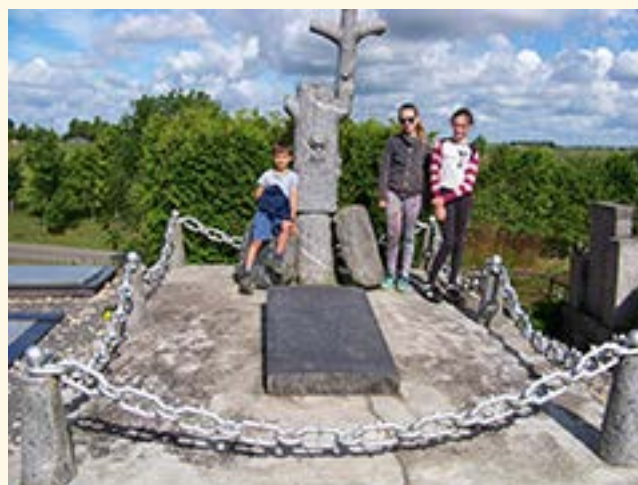
Prie S. Daukanto kapo Papilėje. 2017 m.