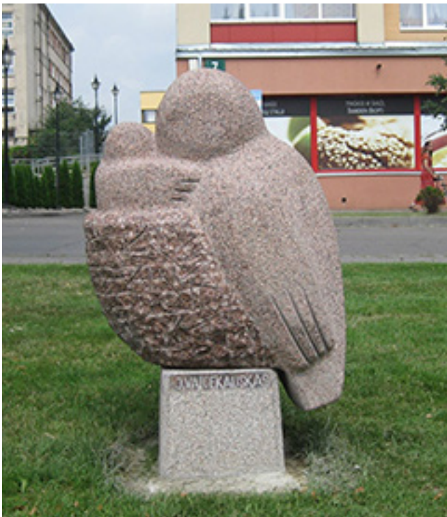
J. Vaicekausko skulptūra, sukurta Kelmėje 2016 m.

nimus ir brandžią metų patirtį. Jis priglaudė ir margaspalvių žmonių būrį, kuris tarsi išmoninga mozaika pagyvina tvirta ranka nukaltą vyrišką tekstą. [...].