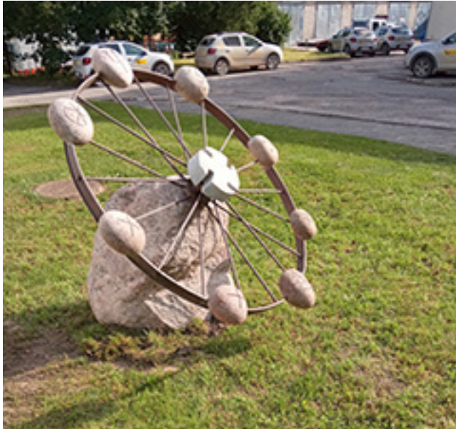
J. Vaicekausko 2022 m. Kelmėje vykusiame ekmen-tašių simpoziume sukurta skulptūra „Rėdos ratas“