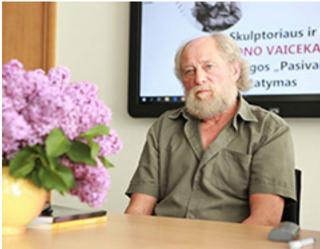
Skulptorius ir rašytojas Jonas Vaicekauskas per knygos „Pasivaikščiojimai“ pristatymą 2019 m.