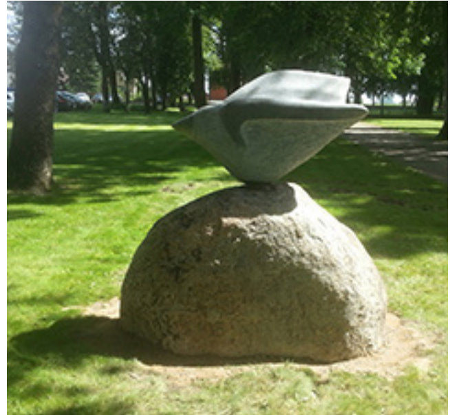
J. Vaicekausko skulptūra, sukurta 2020 m. Kelmėje