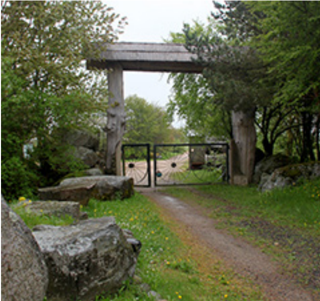
D. Mukienės nuotraukose – Orvidų muziejaus-sodybos vaizdai

šydavo tradicinius kryžius, kartais juos papuošdami plastikos elementais, tai V. Orvidas memorialinių paminklų kūrimo srityje išryškėjo kaip savito braižo liaudies skulptorius. Pasak menotyrininkų, jo sukurti memorialiniai paminklai yra įvairiopi, tačiau jų skulptūrinis dekoras – tik jam vienam būdingo braižo. Jo kūryboje dominuoja savarankiškai interpretuoti krikščioniškieji siužetai bei simboliai. Kūriniai pasižymi vientisumu, gebėjimu monumento puošyboje išnaudoti natūraliai susiklosčiusią akmens formą bei jo spalvą. Daugelyje jo sukurtų paminklų ryški plastinių formų disproporcija ir savita dinamika, o grubi tašymo faktūra dar labiau padidina plastikos ekspresyvumą.